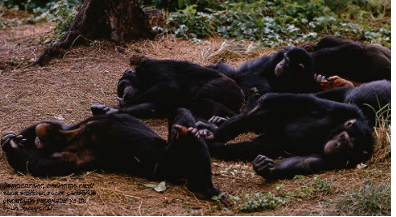
Şempanzeler, beslenme saati sona erdikten sonra genellikle şekerleme yapıyorlar ya da oyun oynuyorlar.

lemek amacıyla avlanıyorlar. Yavru şempanzelerse oyuncak niyetine satılmak, sirklerde palyaço olarak yetiştirilmek ya da tıp deneylerinde kullanılmak üzere yakalanıyorlar. Birçoğu, özellikle Ortadoğu ülkelerinde ev hayvanı olarak satılmak üzere, Entebbe Uluslararası Havaalanı'ndan denizaşırı ülkelere kaçırılıyor. Yabani yaşamın korunması için çalışan gönüllüler, bu yollarla insanların eline düşen her şempanze için yaklaşık 30 başka şempanzenin öldürüldüğünü düşünüyorlar.