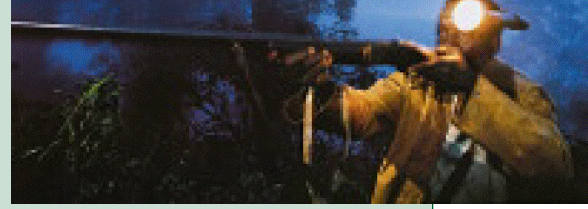
Kaçak avcılar, geceleri şempanze avına çıktıklarında başlarına taktıkları lambalardan yararlanıyorlar. Lambanın yaydığı ışık, hayvanların gözlerinin parlamasını ve daha kolay fark edilmelerini sağlıyor. Işık, şempanzelerin üzerine düştüğünde hayvanlar kımıldamadan öylece yerlerinde kalıyor. Bu da vurulmalarını kolaylaştırıyor.

hayvan dışkılarıyla yayılabilen birçok bitki türü, taşıyıcıların azalması nedeniyle yaşam olanaklarını yitiriyor. Aşırı avlanma, pigmelerin besin kaynaklarını yok ediyor. Dolayısıyla da bu insanların ormandaki yaşamını güçleştiriyor.