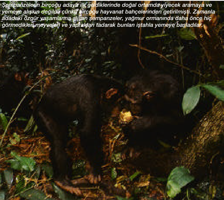
Şempanzelerin birçoğu adaya ilk geldiklerinde doğal ortamda yiyecek aramaya ve yemeye alışkın değildi çünkü birçoğu hayvanat bahçelerinden getirilmişti. Zamanla adadaki özgür yaşamlarına alışan şempanzeler, yağmur ormanında daha önce hiç görmedikleri meyveleri ve yaprakları tadarak bunları iştahla yemeye başladılar.

Bahati'yle birlikte, yaşları 2-12 arasında değişen altı erkek ve 13 dişi şempanze 1998 yılı sonunda Entebbe'den