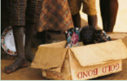
Bu goril yavrusunun annesi, eti için avcılar tarafından öldürülmüş. Yavru, "oyuncak" olarak satılmayı bekliyor. Ne yazık ki goriller, tutsaklığa şempanzeler kadar uzun süre dayanamıyorlar. Çoğu, yetersiz beslenme ve çökkünlük nedeniyle erken yaşta ölüyor.

Afrika'da yaşayan şempanzeler, goriller ve bonobolar (cüce şempanzeler) ile Güneydoğu Asya'da yaşayan orangutanların oluşturduğu iri insansımaymunlar, yaşam alanlarının yok edilmesi, kaçak avcılık ve hayvan ticareti yüzünden hızla yok olmaktalar. Özellikle yağmur ormanlarının kereste ticareti, tarımcılık ve orman yangınları yüzünden hızla yok edilmesi, bu türlerin sürekliliği için büyük bir tehdit oluşturuyor. Borneo ve Sumatra adalarında yaşayan orangutanlar son yıllarda sıkça görülen orman yangınlarından büyük zarar görüyorlar. Orta ve Batı Afrika ülkelerinde yaşayan şempanzeler, bonobolar ve goriller de, en çok, yağmur ormanlarının derinliklerinde etkinlik gösteren kereste şirketleri ve kaçak avcılık yüzünden ölüyorlar. Bilim adamları, insansımaymunların bu hızla yok olmaya devam etmeleri halinde, önümüzdeki 50 yıl içinde yeryüzünden silinmelerinden endişe duyuyorlar.