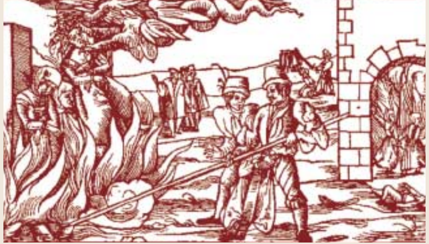
Cadılık suçlamasına uğrayanların sonu genellikle yakılarak idamdı.

Benzer bir gerekçeyle de İngiliz doktorları parlamento'ya bir dilekçe vermişler, bazı gereksiz ve muzır kadınların "fizikçilik mesleği"ni icraya cesaret etmeleri nedeniyle yüksek para ve hapis cezalarıyla cezalandırılmalarını istemişlerdi. 1400'lerde artık doktorluğun, şehirli okumuş tıp pratisyenlerine karşı verdiği savaş bütün Avrupa'da zaferle sonuçlanmıştı. Bu zafer, üst düzeylerin sağlık hizmetlerinde erkek doktorların tartışmasız tek yetkili olduğunu getirmişti. Bunun dışında kalan sağlık pratisyenlerinin büyücülükle suçlanıp ortadan kaldırılmalarının önü, kilise tarafından açılıyordu. Öyle ki cadılık suçlamasıyla kovuşturulan kadınların büyüyle uğraşıp uğraşmadığına ya da büyülerinin zararlı olup olmadığına karar veren kişiler, doktorlardı. Cadıların Çekici'nde şöyle yazıyor: "Ve bir hastalığın büyüleme yoluyla mı yoksa fiziksel bir etkiyle mi ortaya çıktığını ayırabilmek için her şeyden önce bir doktorun tanısına başvurmak gerekir."