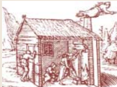
Cadılar hakkındaki en yaygın görüş, süpürgeye binerek uçtuklarıydı.

Büyücü avları süresince kilise de, doktorların profesyonel tababetini açıkça yasal olarak tanımlamışken, profesyonel olmayan tababeti, büyücülük uğraşları içinde sınıflamıştı: "Eğer bir ka-