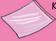
Kilitli plastik poşet