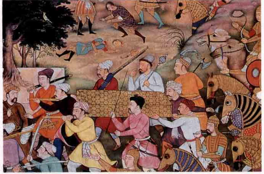
Londra'daki Britanya kütüphanesinden Cengiz Han'ın savaşlarını ve cenaze törenine katılanların kılıçtan geçirilişini gösteren iki minyatür.

Bütün Asya'ya hükmedecek olan Temuçin bu olay sırasında zayıflıklarından birini gösterir ve canını kurtarmak için karısını bırakıp Burhan-Haldun Dağı'na kaçar.