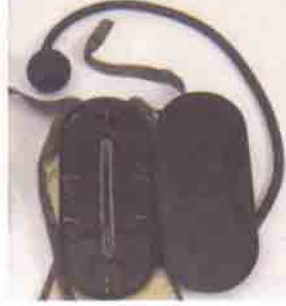
Soldaki makinenin mekanizması görülüyor. Bu makine altı poz çekebiliyordu.