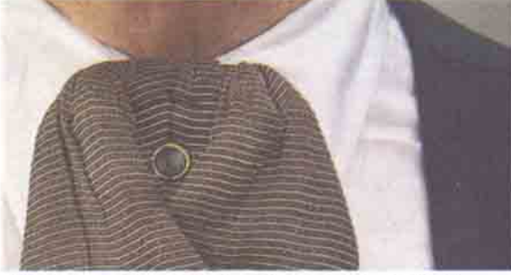
1890 Fransız Kravat Fotoğraf Makine'sinin objektifi boyunun hemen altında görülebilir. Fotoğraflar, pantolon cebindeki bir pompanın sıkılmasıyla çekiliyordu.

Kaynaklar: Steward, D. "One Shutterbag Wears More Than Meets The Eye". Smithsonian, Haziran 1987