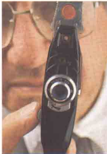
16mm'lik kalem makine, 1950 Paris yapımı. Cebe sığan bu makine 18 poz çekebiliyordu.