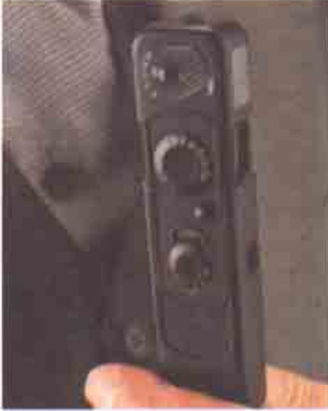
Minox, 1937, II. Dünya Savaşı'nda iki tarafında kullandığı bir casus fotoğraf makinesiydi.