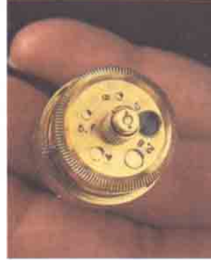
Bir alyans altına gizlenmiş, İtalyan yapımı bu makine, farklı diyafram açıklık seçenekleri taşıyor.