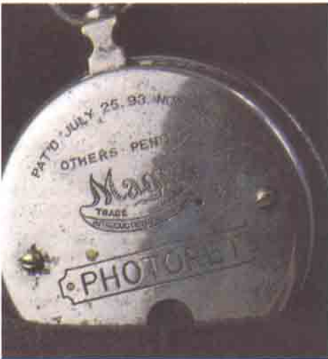
Cep saati içine gizlenen bu makine, 1893'te Edison'un asistanı, William Dickson tarafından tasarlanmıştır.