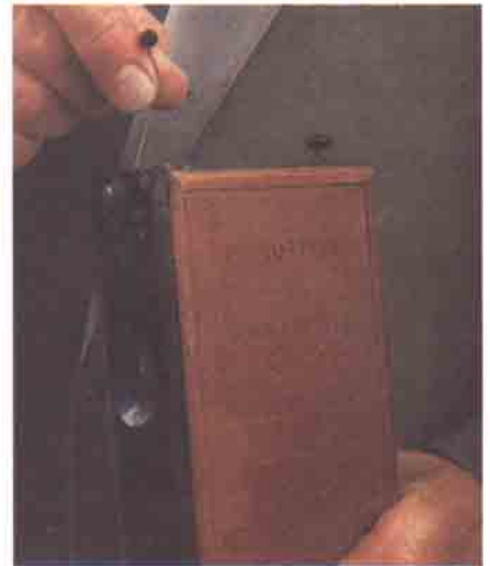
1888 Alman yapımı Photo-Livre, ismi gibi bir kitap görünümündeydi. Bu makineyle 24 poz çekebiliyordu.