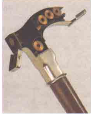
1902'nin bir makinesi olan Ben Akiba isimli bu baston, objektif ve filmleri sapında taşıyor.