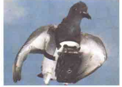
I. Dünya Savaşı'nda Almanların kullandığı bu makine, bir güvercin üzerine takılarak Fransızları görüntülemek için kullanılıyordu.