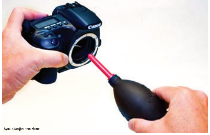
Ayna odacığını temizleme

Makineyi temiz tutma konusundaki bütün çabalarınıza karşın algılayıcıda temizlik gerektirecek boyutta, önemli bir kirlenmeyle karşı karşıyasınız. Bütün bir algılayıcı temizlenecek olsa da o "hain tozlar"ın yerleştiği yeri tam olarak bilmek çok yararlı. Lekenin görüntü üzerindeki yerini aklınızda tutun. Test görüntüsünün var olan konumunu hem tersine hem de başaşağı döndürerek lekenin algılayıcı üzerin-