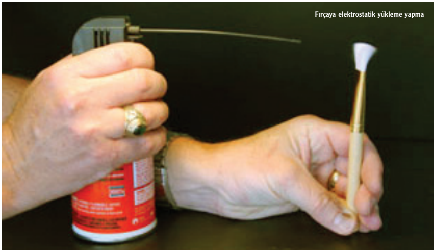
Fırçaya elektrostatik yüklemeye yapma

Algılayıcıya üfleme: "Sensor Clean" moduna ayarlı makine şimdi temizlik için hazır. Her türlü iri toz parçalarını