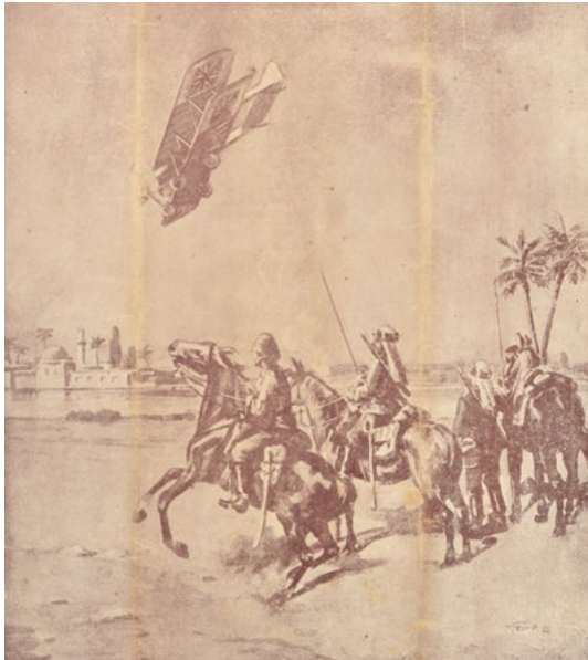
Kütulamâre’deki İngiliz ordusuna havadan gıda malzemesi taşırken Türk birliklerince düşürülen İngiliz uçağı

İngiliz ordusu komutanı General Townshend, Kütulamâre’ye sığınıp savunmaya geçtiğinde en geç 1-2 ay içinde gelecek yardımcı kuvvetlerin kendilerini kurtaracağını düşündüğünden, kuşatmanın 4,5 ay süreceğini ve yiyecek stoğunun tükeneceğini hesap etmemişti. Şubat 1916’dan itibaren yiyecek azalmaya, Mart’tan itibaren de orduda bulunan at ve katırlar kesilip yenmeye başlandı. Fakat İngiliz ordusunda bulunan Hintliler -Müslümanlar dahil- at eti yemeyi reddettilerinden zor durumda kalmışlardı. Townshend, bu askerlerin at eti yemeleri için Hindistan’da bulunan dini önderlerinden fetvalar almak zorunda kalmıştı. Yiyecek sıkıntısını gidermek için başvuru olan havadan ve nehirden ikmal ise aşağıda görüleceği üzere çok da etkili olmamıştır.