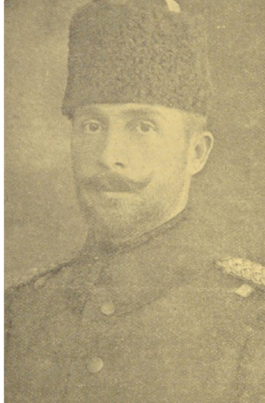
Osmanlı Irak Ordusu Genel Komutanı Yarbey Süleyman Askeri Bey (solda)