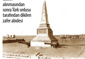
Kütulamâre'nin teslim alınmasından sonra Türk ordusu tarafından dikilen zafer abidesi