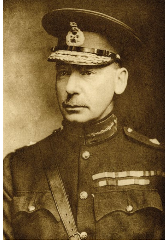
Kütulamâre’de esir düşen İngiliz generali Townshend