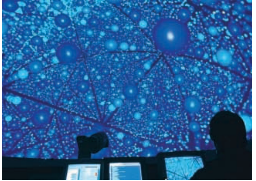
Planetaryumlardaki gösteriler, gökyüzü manzarasıyla sınırlı kalmaz. Bunun yanı sıra, daha farklı konularla ilgili insanı içine alan gösteriler de yapılır. Lazerli projeksiyon, bu gösterilerde kullanılan tekniklerden biri. Burada, bir kristalin iç yapısı kubbeye yansıtılmış.

Tüm sayısal projeksiyon sistemlerinde olduğu gibi, bu sistemlerde de görüntü piksel denen küçük noktaların ekranda dizilmesiyle oluşturuluyor. Basitçe anlatmak gerekirse, sistem ne kadar fazla piksel üretebiliyorsa görüntü kalitesi o oranda yükseliyor. En gelişmiş sayısal planetarium projektörleri, artık insan gözünün algılayabileceği çözünürlük sınırına yaklaşmış durumda. Gelecekte, optik-mekanik projektörlere göre daha düşük maliyetleri ve kullanım alanlarının daha geniş olması sayesinde, en azında küçük planetariumlarda sayısal projektörlerin daha yaygın olarak kullanılacağını öngörebiliriz.