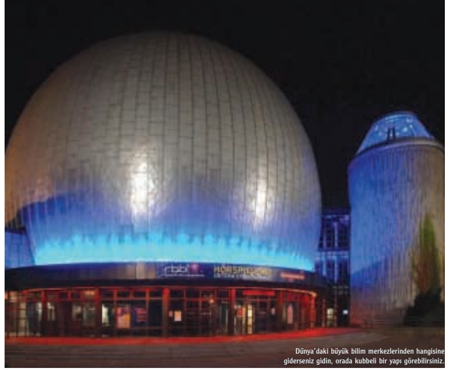
Dünya'daki büyük bilim merkezlerinden hangisine giderseniz gidin, orada kubbeli bir yapı görebilirsiniz.

Sinema salonlarında, eğer ortamda toz ve duman varsa projektörden çı-