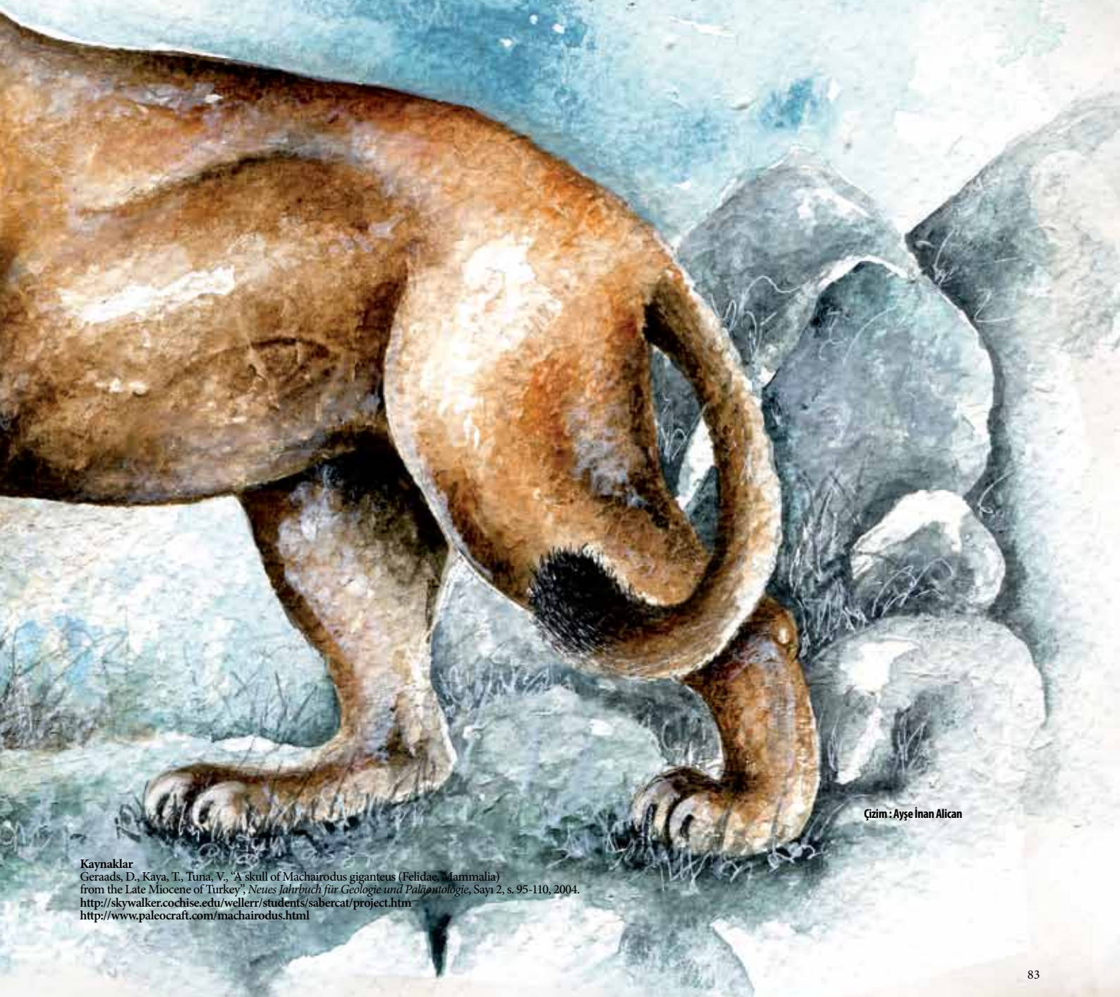
Çizim : Ayşe İnan Alican

Kılıçdişli kedilerin Anadolu'da yaşayan türü Machairodus giganteus idi. Machairodus giganteus türünün yaklaşık 180 cm'lik boyları ile en büyük kılıçdişli kedilerden oldukları tahmin ediliyor. Bu türün Avrasya'da 15-2 milyon yıl önce yaşadığı fosil kayıtlarından biliniyor. Anadolu'da bulunan fosillerse yaklaşık 7 milyon yıl önce öncesine ait.