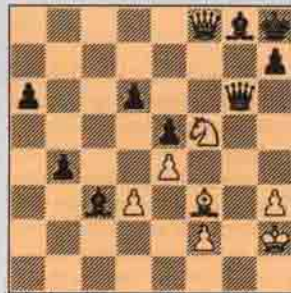
III. Sıra Beyazda