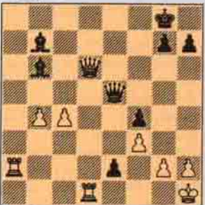
IV. Sıra Beyazda