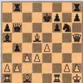
V. Sıra Beyazda