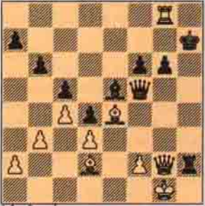
I. Sıra Beyazda