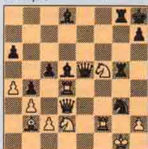
IX. Sıra Beyazda