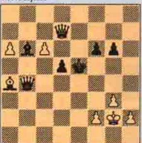
VII. Sıra Beyazda