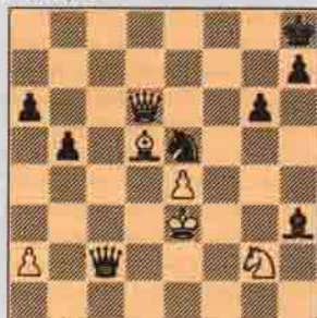
VI. Sıra Siyahla