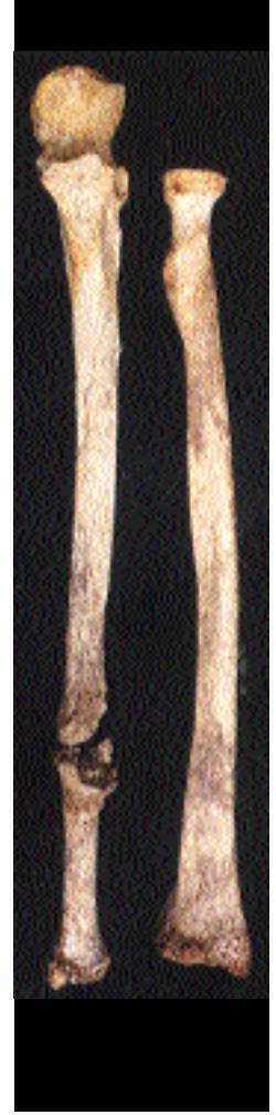
Moçelerin Ay Piramidi tapınağında, üstünde büyük bir delik olan kafatasları bulundu. Kurbanların kafasına ağır bir cisimle vurulmuştu. Yakındaki bir rahip mezarında kanla kaplı bir lobut bulundu. Kurbanların dirsek kemiklerinde, bir darbeyi karşılarken oluşmuş kırık izleri vardı (sağda).

bile yokken, ortaya birdenbire hemen hiç tanınmamış Kanadalı bir kazıbilimci çıktı: Steve Bourget. Bourget beş yıldır Moçelerin insan kıyım tapınaklarını arıyordu. Halen İngiltere’de Doğu Anglia Üniversitesinde öğretim üyesidir. Montreal Üniversitesi’nde “Moçe sanatı ve kutsal coğrafyası” üzerine doktora tezi yazmıştı. Bourget, çalışmalarını sırasında, rahiplerin insanları dağ tepelerinden uçurumlara atarak öldürdüğünü gösteren birçok resim buldu. Bu, o bölgenin inançlarına uygundu; İnkalar dağ tepelerini kutsal sayardı. Çömlekler üzerindeki resimler gerçeği anlatıyorsa, kurban etme işi küçük dağların yamaçlarındaki Moçe tapınaklarında yapılmış olabirdi.