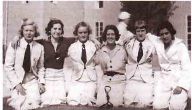
Kolejde başladığı eskrim sporuna üniversite yıllarında da devam eden Çambel, 1936 Berlin Olimpiyatları'nda ülkemizi temsil eder. Bu da ona Suat Fetgeri Aşeni (soldan ikinci) ile beraber (sol başta) Olimpiyatlar katılan İlk Türk Kadın Sporcu ünvanını kazandırır (Sağdaki fotoğraf).