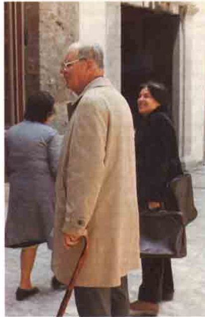
Mayıs 1983'de, uzun yıllar beraber çalıştığı Prof.Dr. Kurt Bittel ile İstanbul'da

"Biz de o günlerde Karatepe'de devam eden inşaatla uğraşıyorduk. O sırada bir fırsat olsa da uzun bir izin alabilsem diyordum. O zaman tam bir izin oldu. Hatta dekan Takiyeddin Mengüşoğlu'na telefon edip, geleyim de hiç olmazsa sınavları yapayım; çocuklara bir zararı olmasın dedim. Yanıtı olumlu olmadı, çünkü o da uzaklaştırılanlar arasındaydı."