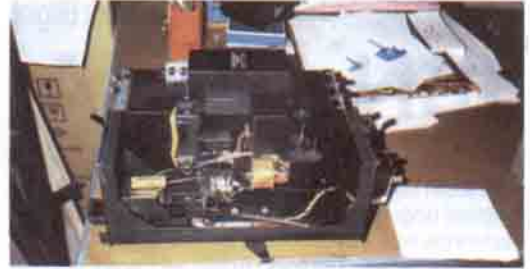
Görçek'in film yükleme-hazırlama mekanizması.

Bu ay sizlere Sayın Fikret Kaftanoğlu'nun ilk ürünlerinden olan "Görçek"i tanıtacağız.