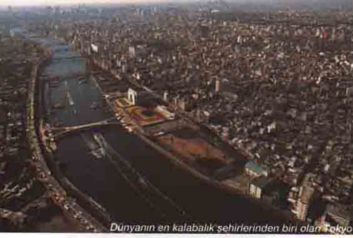
Dünyanın en kalabalık şehirlerinden biri olan Tokyo