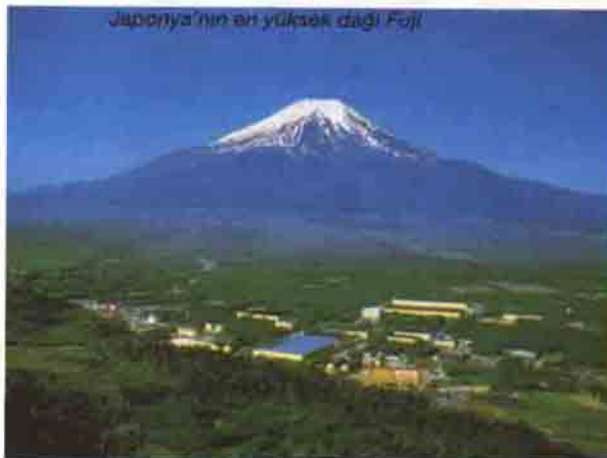
Japonya'nın en yüksek dağı Fuji