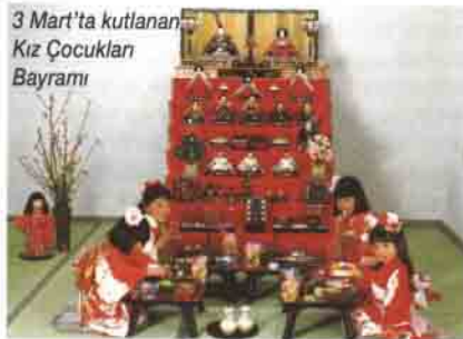
3 Mart'ta kutlanan Kız Çocukları Bayramı

Japon insanı "organizasyon adamı" olarak tanımlanabilir. Yaptığı işi değiştirip başka işe atlamaktansa çok çalışmayı tercih eder. Karşısına çıkan zorluklarda geçmişten güç ve esin alır; yani geçmişle bugünü bağdaştırır. Doğayla barışık olma, doğayı iyi tanıyarak ondan yararlanmaya çalışma ilkesi ise Japonları kaynakları rasyonel şekilde kullanmaya iter. Ayrıca çok sabırlı bir ulus olan Japonlar, başarısızlıktan hemen yılmazlar. Yaparken öğrenirler, yaptıkları şeyi yeniden dener ve hep daha iyisini yapmaya çalışırlar. Ancak keşfedilmiş şeyleri yeniden keşfetmeye çalışmazlar, onları geliştirmeye uğraşırlar.