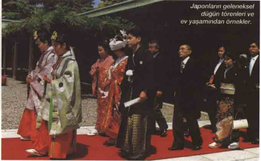
Japonların geleneksel düğün törenleri ve ev yaşamından örnekler.

Diğer taraftan, Japonlarda grup inancı vardır. Bireyci değildirlir. Her şeyi grup halinde yaparlar. Bu iş, küçük bir işyeri, büyük bir değirmen, tarla, balıkçı teknesi, kısacası her şey olabilir. Grup çalışmasında oldukça başarılıdırlar. Ücretler ise kişinin kıdemine, yani o işte geçirmiş olduğu süreye göre belirlenir. Bir Japon bir kuruluşa girdiğinde o kuruluşla bütünleşir ve kendisini ömür boyu