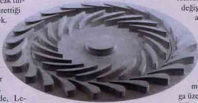
MIT'nin Gaz Türbini Laboratuvarı'nda, geliştirilen 4 mm'lik bir mikrotürbin rotoru.

Yüksek çevre hızlarında ise rotor çevresi yüksek gerilmelerin etkisi altında kalıyor. Eğer rotorun yapılacağı malzeme bu gerilmelere dayanacak denli sağlam değilse rotor parçalanabiliyor.