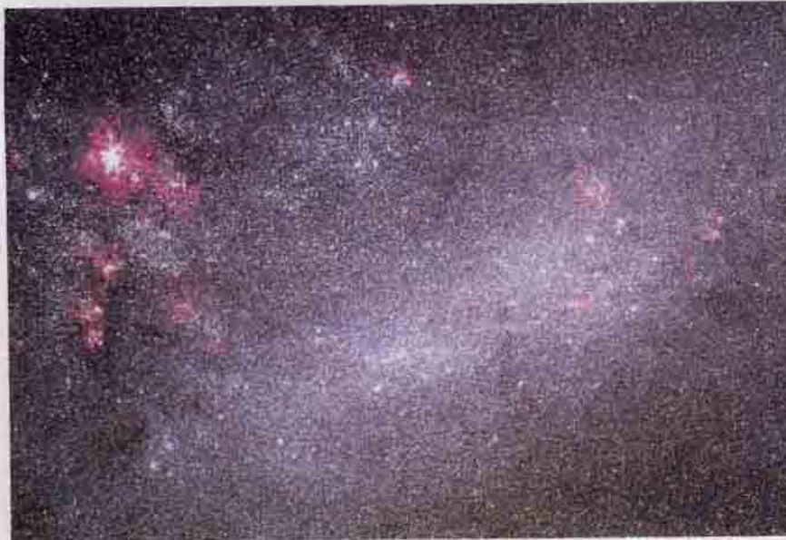
Samanyolu'nun uydu gökadalardan birisi olan Büyük Magellan Bulutu, içerisinde uzaklık ölçümlerinde kullanılan standart ışık kaynaklarını barındırır.

Bu ışık kaynaklarının arasında, RR Çalgı yıldızları da yer alıyor. Bu