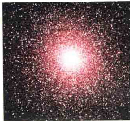
47 Tucanae olarak adlandırılan bir küresel yıldız kümesi. Küresel yıldız kümeleri, içlerindeki sıcak, mavi yıldızlar sayesinde yaş belirlemelerinde kullanılırlar.

Hipparcos'tan bir sonraki adım, yine ESA'nın göndereceği GAIA (Global Astrometric Interferometer for Astrophysics) uydusuyla atılacak. Bu uydunun 50 milyonun üzerinde gök cisminin paralaksını ölçecek. Bu uydunun ayırma gücü, Hipparcos'unkinden biraz daha düşük, yaklaşık 10 miliark saniye olacak.