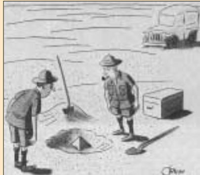
Asrın keşfi olabilir, tabii ne kadar derine indiğine bağlı,

Alkış deyince değinmeden geçilemeyecek bir örnek daha var: Avustralyalılar bugün Türkler için şöyle derler: "Artık dostumuz olan kahraman düşmanımız." Çanakkale Savaşları'na katılan Anzaklar ise şöyle derlermiş: "Temiz dövüşürler. Türkler... Onlar en mert savaşçılar." Evet, yaralı düşman askerini kurşun yağmuru altında sırtında taşıyarak kendi siperlerine teslim edecek kadar mert... Silah seslerinin, top gü-rültülerinin eksik olmadığı o savaş günlerinden bir akşamüstü, Türk siperlerinden genç bir asker yanık ve güzel sesi duyulur: türkü söylemektedir. Askerler, en gü-rültüsüz zamanda dahi tek tük patlayan silahların hepsi, hatta tabiat bütünüyle susmuş dinlemektedir. Türkü bittiğinde düşman siperlerinde şiddetli bir alkış kopar ve uzun müddet devam eder. Daha biraz önce o ağır kan kokusu altında birbirini boğazlayan, biraz sonra da birbirini boğazlamaya devam edecek taraflar arasında, sadece sanatın savaşa üstün geldiği pek nadir anlardan biri değil, insanlık tarihindeki en olağanüstü olaylardan biri olsa gerek.