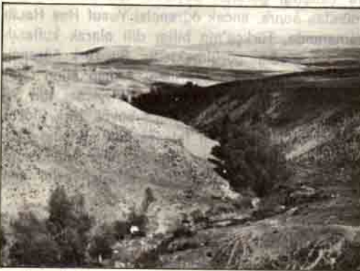
Göller Köyü mezarlığının bulunduğu, dağlık ve yer yer ağaçlık arazi.

Çorum-Merzifon kara yolunun 30 Km. sinde, yolun solunda ve yaklaşık olarak yoldan 5 km. içerde bulunan Göller köyü mezarlığı, Köyün 1500 m. kadar uzağında bulunmaktadır. Ne yazık ki defineciler tarafından tahrip edilmiş olan bu Eski Tunç Çağı mezarlığı, dağlık ve yer yer ağaçlık bir arazide bulunmaktadır. Yavvan bir tepenin güney yamacına kurulmuş olan