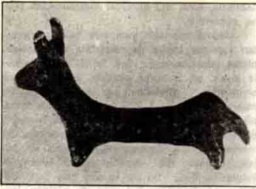
Kültürle ilgili eserlerden, tunç hayvan heykelciği.

dürler. Bu, bütün Anadolu'da görülen eski bir âdettir. Alacahöyük, Ahlatlıbel ve Etiyokuşu'nda bulunan benzerlerinin tümü Eski Tunç Çağı III. tabakalarında bulunmuştur.