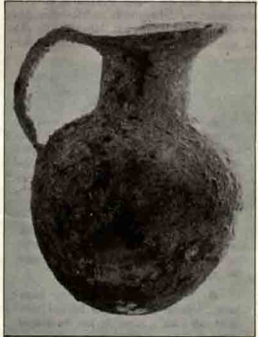
Madeni eserlerden, kurşundan yapılmış gaga ağızlı testi.

Madeni eserlerin yanı sıra, pişmiş topraktan yapılmış kaplar da mezarlara ölü hediyesi olarak bırakılmışlardır. Tek renkli ve çoğunlukla siyah, gri hamurlu olan bu seramiğin kap biçimlerini, çömlekler, tek kulplu çanaklar, maşrapalar ve iki kulplu bardak (Depas Amphikypellon) oluşturmaktadır. İki kulplu bardağın dışında, tümü elde şekillendirilmiştir. Bu iki merkezin tarihlendirilmesinde şüphesiz en büyük yardımcı, tek örnekle temsil edilen iki kulplu bardaktır. Bu tip kaplar, Eski Tunç Çağının son evresinde bol miktarda görülür. Aralarında çok az yerel farklar vardır. Elde yapılmış olanları da mevcuttur. Buradaki örneğin en yakın benzerleri, Truva, Acemhöyük, Kültepe ve Karaoğlan'da bulunmuş olanlardır. Bu eserlerin de tahrip edilmiş mezarlara ölü hediyesi olarak bırakıldıkları şüphesizdir. Bu durumu definciler de doğrulamıştır. Bu çanak-çömlek, Orta Anadolu'nun kuzey kesiminde yapılmakta ve kullanılmakta olan seramik çeşitidir. Daima tek renkli, kırmızı, siyah, kertiklerle, çizgilerle ve siyah üzerine beyaz boya ile süsü-