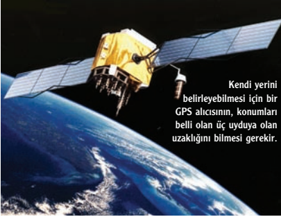
Kendi yerini belirleyebilmesi için bir GPS alıcısının, konumları belli olan üç uyduya olan uzaklığını bilmesi gerekir.

Bir yerin konumunu nokta olarak belirlemek için GPS uyduları ile GPS alıcıları birlikte çalışırlar. GPS uydusu sisteminin nasıl çalıştığını anlamak için, üçyanlılığın nasıl olduğunu anlamakta büyük yarar var.