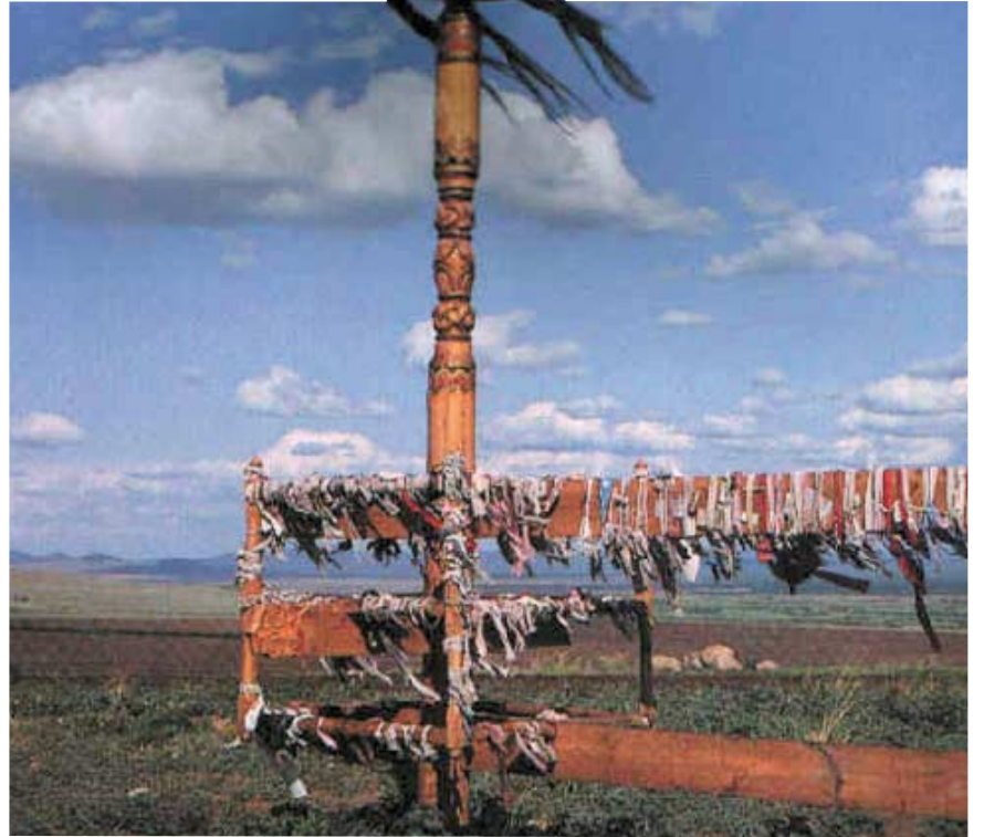
Şaman ayini sırasında dikilen kutsal direklere, ruhlara dilek dilemek amacıyla adak olarak çaput bağlanır. Benzer biçimde şaman ağacı, ya da dilek ağacı da denen ağaçlara çaput bağlanmasına ülkemizde de rastlanır.

Bu demir sopaya hastanın içindeki kötü ruhları kovan on sekiz kadar demir çingirak bağlanır. Ayrıca, kaminin habercilerini temsil eden iki