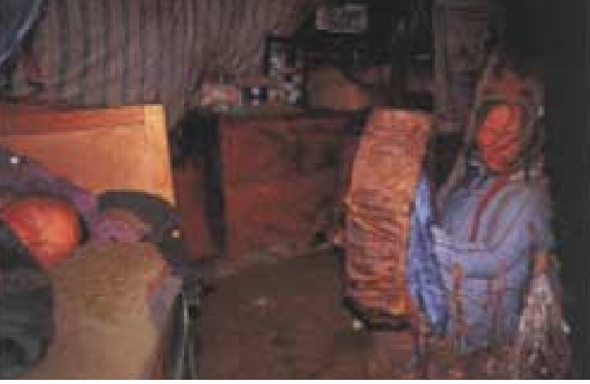
Şaman, kötülükleri uzaklaştırmak için hastanın yanında davul çalıyor.

ğüt dalından; ya geyik kemiği ya da boynuzundan ya da kayın ağacından yapılır. Tokmağın sapına hastaya gelen kötü ruhları kovmak için kamçı görevi gören bez ve deri parçaları yapıştırılır.