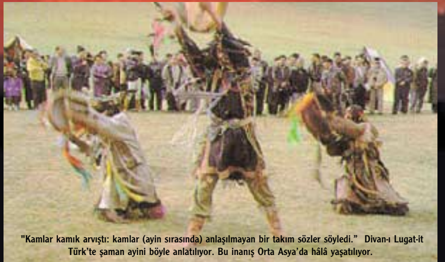
"Kamlar kamık arvişti: kamlar (ayin sırasında) anlaşılmayan bir takım sözler söyledi." Divanı Lügat-it Türk'te şaman ayini böyle anlatılıyor. Bu inanış Orta Asya'da hâlâ yaşatılıyor.

Kaşgarlı Mahmut'tan öğrendiğimize göre kamlar, Müslüman Türkler zamanında da unutulmuş değil. Divanı Lügat-it Türk'te "Kamlar kamık arvişti: kamlar (ayin sırasında) anlaşılmayan bir takım sözler söyledi." gibi cümlelere