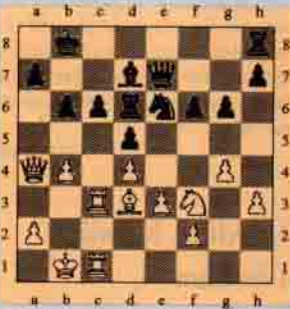
I. Beyaz oynar kazanır.