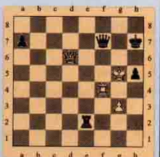
IV. Siyah oynar kazanır.