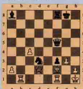
VII. Siyah oynar kazanır.