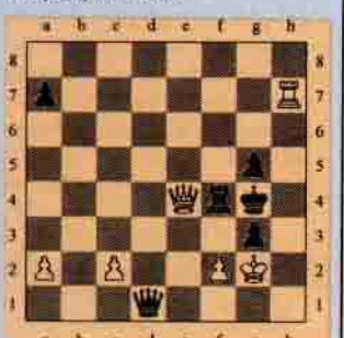
VIII. Beyaz oynar kazanır.