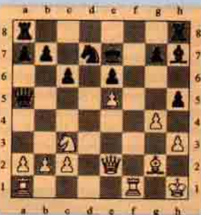
V. Beyaz oynar kazanır.