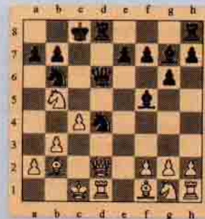
II. Siyah oynar kazanır.