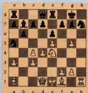
III. Beyaz oynar kazanır.