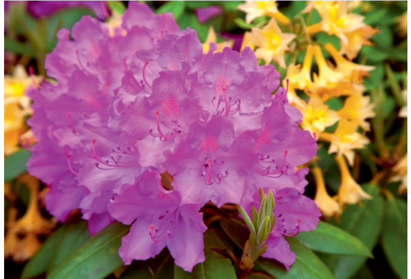
Çizim: Ersan Yağız