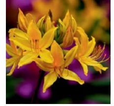
Yukarıda Rhododendron ponticum (pembe ormangülü) ve Rhododendron luteum (sarı ormangülü) doğada bir arada (üste)