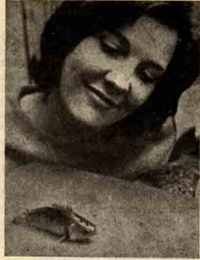
Yukarıdaki, resimde yürüyen balık Londra hayvanat bahçes'inde bir hayranıyla

Evet, yürüyen balık diyebileceğimiz bu balık, yağmurlar kesilip içinde yaşadığı su ortamı kuruyunca, kendisini solungaçlarının