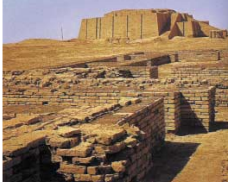
Sümer kentlerinin en önemli öğelerinden biri ziggurattı.

larına bakılmaksızın kent olarak kabul edilebilirler. Öyleyse bir yerleşim yerinden kent olarak söz edebilmek için yapısal değil, sosyolojik bir tanıma gereksinim duyuyoruz. Kent, insanların birbiriyle buluştukları, malların değiş tokuş edildiği ve fikirlerin yayıldığı bir merkezdir. Kentte farklı faaliyet türleri bir araya gelir ve her bir unsurunun birbirine sıkı sıkıya bağlı olduğu dışı açık bir sistem vücut bulur. Bu bakımdan kent, kendine özgü özellikleri bulunan ve belli bir mekanda yoğunlaşmış yerleşim sistemidir. Bu yerleşim sisteminde karmaşık toplum yapısının birey ya da aile düzeyinde çözülemeyecek sorunlarının üstesinden gelinmesine olanak sağlanır. Yerine getirdiği işlevlerin sayısı ve karmaşıklığıdır kenti köyden ayıran. Bu anlamda birçok tarihçi kentsel gerçekliği toplumsal yapıya dayandırarak anlamaya çalışırken, kazıbilimciler arkeolojik araştırmalar sonucunda kentin morfolojik (biçimsel) analizini yapmaya yönelmişlerdir. Bunun sonucu olarak, Yunan ve Roma kentlerinin anıtsallığı karşısında hayranlığa kapılan kentbilimciler, eski çağ kentlerine aynı ilgiyi yakın zamana dek göstermemişlerdi. Bir agoranın ya da forumun, düzenli kamu yapılarının, bir yol şebekesi üzerindeki binaların yer aldığı klasik dönem sitelerinin yanında, eski doğu kentlerinin karmaşık yapısı bunların aşırı büyümüş köyler olduğunu düşündürmüştü ilk başlarda. Kent planı, o kentin tarihinin de bir ifadesidir aynı zamanda. Plan temelinde o kentin ilerle-