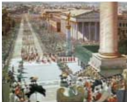
Ben Hur filminden alınan bu sahnede Roma kenti canlandırılmış.

Kentin siyasal, ekonomik, toplumsal ve dinsel işlevleri oradaki kamu yapılarına ve bunların kent çevresi içerisindeki konumlarına yansımıştır. Kentin siyasal ve yönetsel rolüne en çok agora ve forum tanıklık eder. Bunlar Yunan ve Roma kentinin kalbiydi ve kentin geri kalan kısımlarına sokak ağı