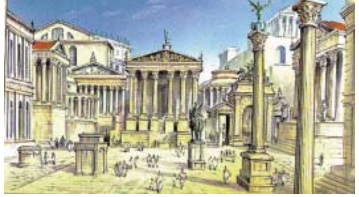
Eski Yunan kentlerinde Akropol kentin en yüksek noktasında bulunurdu. Eski Yunan'da olduğu gibi Roma'da da kentler Akropol merkez olacak şekilde kurulurdu.

diği ya da gerilediği, sürekli unsurları ve değişime uğrayan özellikleri saptanabilir. Ancak arkeoloji bilimi, gelişimi yansıtan planlara çok ender olarak sahiptir. Bugüne dek hiçbir ilkçağ kentinde üç yüz yıldan daha öteye giden ardışık kent planına sahip değiliz.