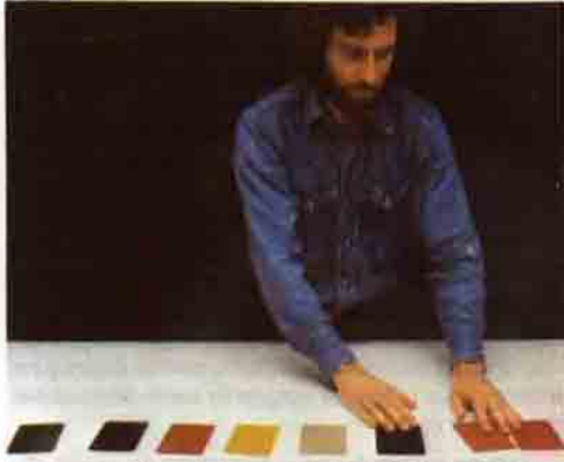
Lüscher Testi. Bilimsel yönü ağır basan bu falda Blumenthal, psikolog Prof. Max Lüscher'in yöntemine göre, renkli 8 kartı gelişigüzel diziyor. Bu falın, o andaki ruhsal durumuna açıklık getirmesi ve içindeki gizli çatışmaları ortaya çıkarması gerekiyor.

Öküstler ve fal sanatının taraftarları ise bunu kesinlikle yadsıyarak, gerçeğin rastlantı gibi şeyleri kesinlikle tanımadığını belirtiyorlar. Onlara göre bizim rastlantı olarak nitelendirdiğimiz şey, gerçeği başka bir ortamda tekrar yansıtan doğa yasalarının bir ifadesinden başka birşey değil. Bunlar dayanak olarak genellikle C.G. Jung'un "Senkronisite" teorisini kullanıyorlar. (June bu teorisini açıklamayan rastlantı ve