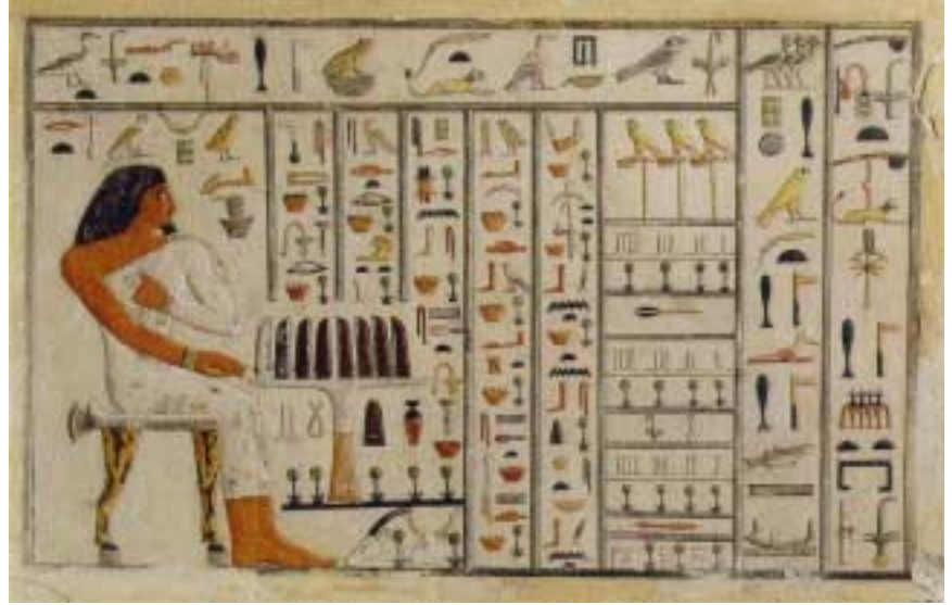
Mısırlıların kullandığı hiyeroglifler aslında yalnızca taş tabletlere ve anıtsal yapılara kazınırdı.

İki ülkenin tam olarak birleşmesi ve tek Mısır olması kolay kabul edilmiş ve hemen gerçekleşmiş bir olay değildi. Bunun en önemli göstergesi 1. Sülale döneminin sonlarında başlayan ve 2. Sülale boyunca süren ayaklanmalar. İki ülkenin kaynaşması tam olarak 3. Sülale döneminin başlarında oldu. Bu dönemde hükümet merkezi de yer değiştirmiş, ne kuzey ne de güney kenti olan Memfis başkent olarak belirlenmişti. Kral Zoser'in başkent yaptığı