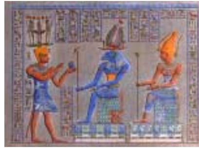
Büyük Tapınak'ın iç avlusu (üstte) ve tapınak duvarlarındaki renkli kabartmalardan bir detay (altta)

Ülke, sayıları otuz sekizi bulan yerel bölgelere (nom) ayrılmıştır. Bunlar ilk zamanlarda tavşan eyaleti, balık eyaleti, köpek eyaleti, yılan eyaleti gibi adlar taşırlar; ki büyük olasılıkla bu da bölgedeki kabilelerin totemlerinin