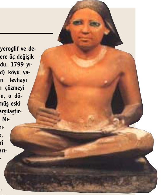
Mısırlı yazıcı: Yazıcılar, papirüs üzerine hiyeratik yazıyla notlar alır sonra bunları temiz çekerlerdi.

levhada Yunanca, hiyeroglif ve demotik yazı olmak üzere üç değişik yazı türü bulunuyordu. 1799 yılında Rosetta (Reşid) köyü yakınlarında bulunan levhayı Fransız Champollion çözmeyi başardı. Champollion, o dönemde gizleri çözülmüş eski Yunan harfleriyle karşılaştırma yaparak, taştaki Mısır yazılarının bazılarının harflerin yerine, bazılarının heceleri belirtmek için, bazılarınınsa tamlama niteliğinde kullanıldığını keşfedecekti. Bu son derece büyük bir keşifti; bu sayede binlerce yıllık görkemli bir imparatorluğun kapıları günümüze açılıyordu.