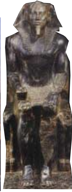
Günümüzde turistlerin ilgisini en çok çeken yapılardan biri olan Sfenks, Firavun Keften'in piramit kompleksinin bir parçasıdır. Sfenks'in yüzünün, firavunun yüzüyle aynı olduğu sanılmaktadır.