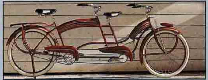
İki kişilik olan ve her iki yönde de sürülebilen Colson Imperial Flyer tandem bisikletin ön tarafındaki pedallar ve gidon, arkadakine oranla daha küçük.