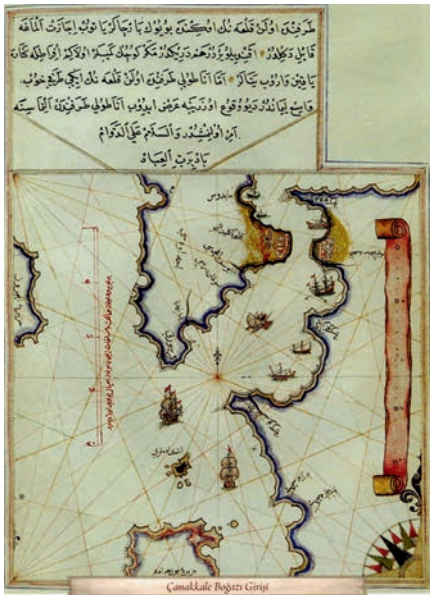
Kitab-ı Bahriye'de Çanakale Boğazının anlatımı ve haritası

İki harita karşılaştırmalı olarak incelendiğinde, dünyada olup bitenlerin izlendiği görülür. Piri Reis'in ve dolayısıyla da Osmanlı Devleti'nin o dönemde kendi içine kapalı olmadığı, Batı'da olup bitenlerin sürekli izlendiği açıkça anlaşılıyor. Piri Reis'in bu tutumu, Osmanlı Devleti'nin güçlü bir devlet olmak için bilgiyi önemseyişinin ve devletin bilginin ışığında büyümesine özen gösterildiğinin açık kanı-