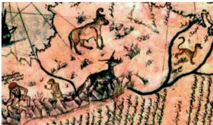
Birinci Dünya Haritasında yer alan garip yaratık resimleri

rim' diyor. İspanya kralı kabul ediyor. Kolomb o sahilleri buluyor ve geri dönüyor."