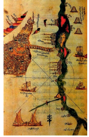
Nil Nehri ve kollarının haritası