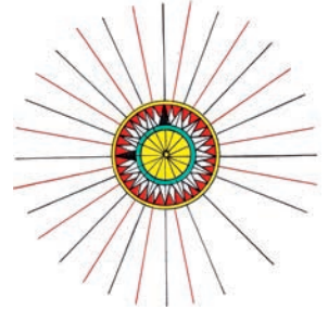
Piri Reis'in haritalarında yer alan rüzgârgülü