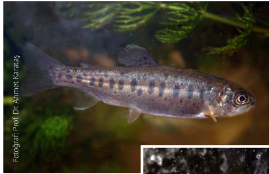
Gökkuşáđı alabalığı ( Salmo gairdneri )