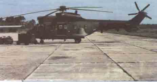
AS 332 PUMA