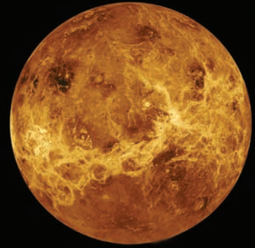
Venüs'te bulutların altının radar görüntüsü.