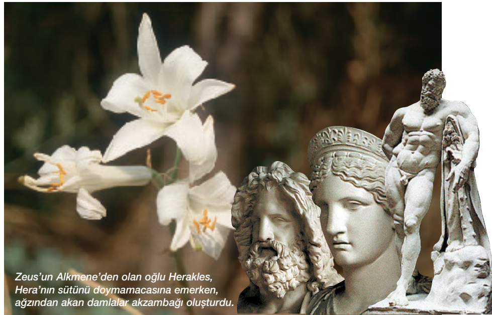
Zeus'un Alkmene'den olan oğlu Herakles, Hera'nın sütünü doymamacasına emerken, ağzından akan damlalar akzambağı oluşturdu.

us'sa, oğlunun Hera tarafından emzirilip, ölmezler arasına girmesini ve ona tanrıların yenilmez kuvvetinin verilmesini istemektedir. Bu nedenle de onun, henüz süt çocuğu olan Herakles'in Olympos'a getirtilmesini ister. Baştanrının isteği emirdir ve Herakles Olympos'a getirilir. Ama Hera'ya bu çocuğu emzir demenin olanağı da yoktur. Bunun üzerine Zeus, oğlunu uyumakta olan karısının göğüslerine yaklaştırır. Çocuk, Tanrıçanın memelerini ağzına alır ve bolca süt emer. Hera'nın sütünü doyanaya kadar emen Herakles emmeyi bıraktığı halde Hera'nın sütü memelerinden aşağıya doğru akmayı sürdürmektedir. Herakles öylesine sıkı