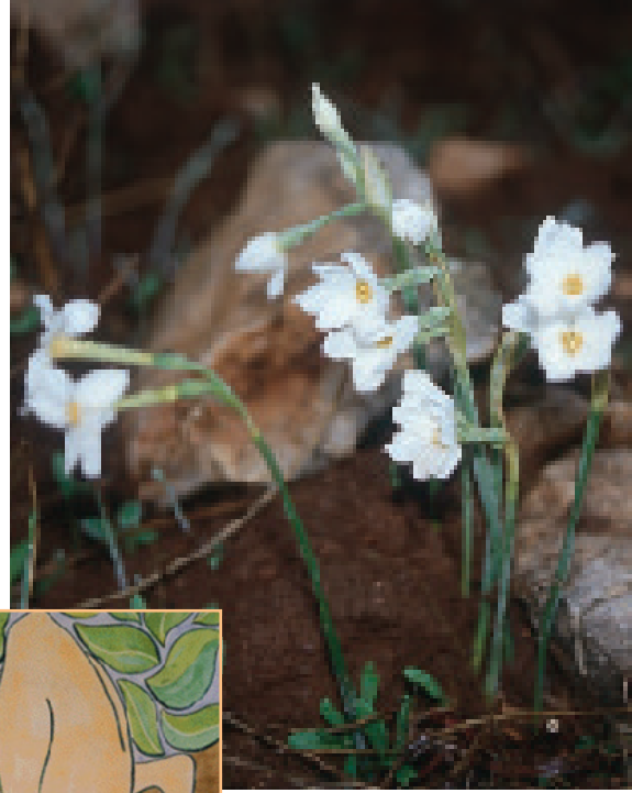
Tanrıların gazabına uğrayan bencil Narkissos, eşsiz güzelliğini suda gördüğünde oradan ayrılmadı ve o da nergis döndü.

Nergisin başta Avrupa ülkelerinde olmak üzere, kuzey ılıman kuşakta kendiliğinden yetişen 40 kadar türü bulunur. Ayrıca melezleme yoluyla üretilmiş 10 binden çok çeşidi olduğunu da belirtelim. Nergis, Nergisgiller ya da Güzelhatunçiçeğigiller ( Amaryllidaceae ) ailesinin Nergis ( Narcissus ) cinsinden, soğanlı bir bitkidir. Pembe, beyaz, sarı, kavuniçi ve kırmızı renkte çiçekleri olan çeşitleri vardır. Çoğunlukla ilkbaharın başlarında çiçek açar; bununla beraber az da olsa, sonbaharda, yağışlardan hemen sonra çiçek açan türleri de vardır. Güneşli yerleri ve suyu sever. Toprağın hemen yüzeyinden çıkarak öbekler oluşturan ince, uzun, sivri uçlu ve yassı yaprakları vardır. Hafifçe yassılaşmış çiçekler, içi boş ve uzun bir sapın ucunda tek tek ya da 2-6 arasında sayıları değişen birlikler halinde bulunur. Her bir çiçek, ortadaki çanak ya da boru biçimli bir yapıyı çevrele-