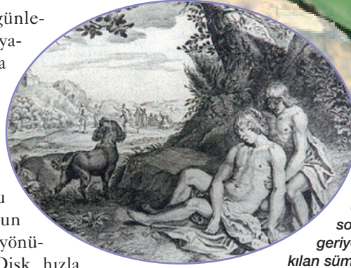
Hyakinthos ve Apollon'un disk oyunu ölümle sonuçlanınca geriye bu aşkı ebedi kılan sümbül kaldı.

Latince terminolojide de, sümbüle adını Hyakinthos vermiş; yani sümbülün Latince adı Hyacinthus orientalis . Ama bir iddiaya göre de bu anlattığımız öyküdeki bitki sümbül değil. Çünkü sümbül o zamanlarda da Yunanistan'ın yerli bitkilerinden değil. Hatta, bu öyküde geçen ve sonra sümbül için kullanılan "Hyacinth" sözcüğünün geçmişi daha eskilere dayanıyor. İncil'de geçen "Vadinin Zambağı" ifadesiyle sözü edilen çiçeğin sümbül olduğu iddia ediliyor. Aslında yaygın olarak "Vadinin Zambağı" bitkisinin Convallaria majalis olduğu düşünülüyor; ama bu tür de İncil'in vatani Filistin'in yerli bitkisi değil, oysa hyacinth yani sümbül yerlisi. Söylencelerdeki bu tartışmalar süredursun, bilinen somut bir gerçek var: O da sümbülün vatanının Anadolu olduğu. O, iki farklı çeşidiyle Toros Dağları'nda can bulmuş. Hyacinthus orientalis alttür, orientalis birinci çeşit ya da alttür. Ülkemizde, doğu Akdeniz Bölgesi'nde, Mersin, Adana, Niğde, Antalya ve Gaziantep'te, 400-1600 m'ler arasında, kalker anakayaya sahip alanlarda yayılış gösteriyor.