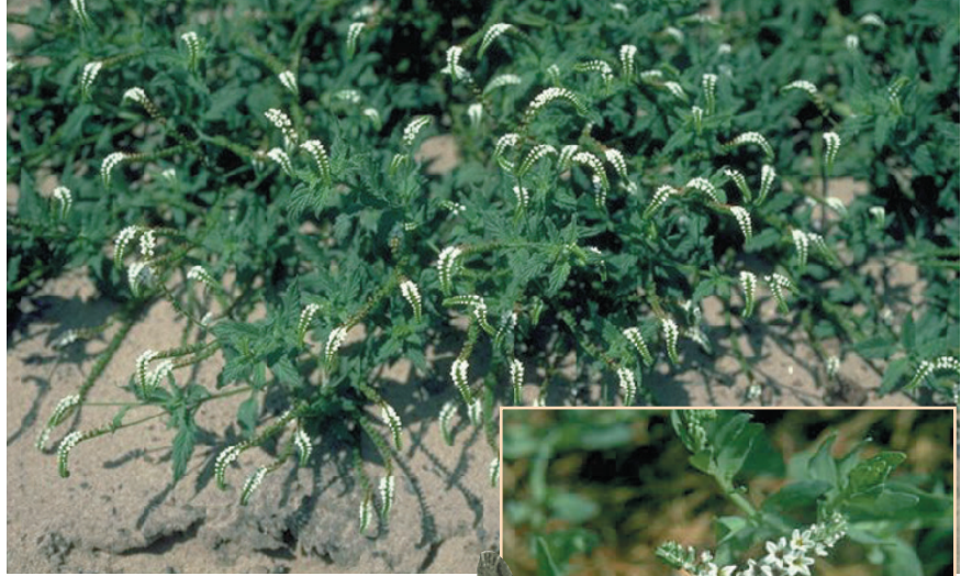
Apollon, Güneşin parlak ışıklarını bir daha göremeyecek olan Klytie'nin ölü bedenini Heliotropium yani günciçeği yaptı. Günciçeği de o günden beri yüzünü hep Güneş'e doğru çevirir. Güneş'i hiç bıkmadan takip edip durur.

Bitkibilimcilerin bir zamanlar 30 kadar bitkiyi içine kattıkları sümbül cinsi, günümüzde yapılan ileri çalışmalar sonunda değişime uğradı. Artık sümbül denildiğinde yalnızca 3 tür akla geliyor. Bunlardan da sadece Hyacinthus orientalis alttür orientalis bah-