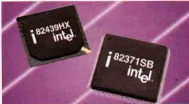
Intel 430HX Yonga Seti

430 TX yonga setleri ise VX'in devamı olarak görülüyor. Bunlar genellikle mobil ve masaüstü sistemlerde kullanılıyor ve 60 ile 66 MHz anakart hızında çalışan 2,5V ile 3,3V kullanan Pentium işlemcileri destekliyor. 256 MB maksimum anabellek kullanma olanağı veriyor; ancak hâlâ, ECC, çok işlemci desteği vermiyor. En büyük gelişme ise yeni DMA/33 EIDE protokolü. Bununla ve uygun özelliklere sahip bir sabit disk ile EIDE arayüzünüzü 33 MB/sn veri hızına ulaştırabilirsiniz. Diğer bir yenilik ise hızlı SDRAM zamanlaması.