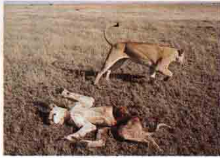
Dişi aslanlar da avlanma alanlarını, su kaynaklarını ve yavrularını korumak için kendi sürülerinden olmayan diğer aslanlara saldırıp, onları öldürmekten çekinmiyorlar.

lıyorlar. Aslında tek yavru anneler sütlerinin çoğunun kendilerinin olmayan yavruya gitmesine izin veriyorlar. Bu dişiler kreş ortakları akrabaları olduğunda daha cömert olabiliyorlar. Bu yüzden süt dağılımı büyük oranda üretim fazlasına ve kan bağına dayanıyor. Bu faktörler türler arası dişi davranışını da belirliyor: Komüne dayalı emzirme, çok yavrusu olan ve küçük akraba grupları halinde yaşayan farceler, domuzlar ve etoburlarda en çok görülüyor.