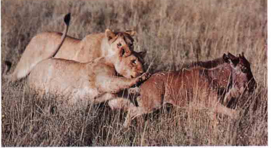
Av takibi genellikle tek bir aslan tarafından yapılıyor ve diğerleri kenardan seyrediyor. Eğer, zorlu bir avsa sürüdeki diğer aslanlarda ava katılıp, paylarını alıyorlar.

nen birçok kreşte, her durumda her yavruyu gruptaki her annenin emzirdiği görülmüş. Ortak emzirme aslanların işbirliği becerilerinin en başta gelen şekli.