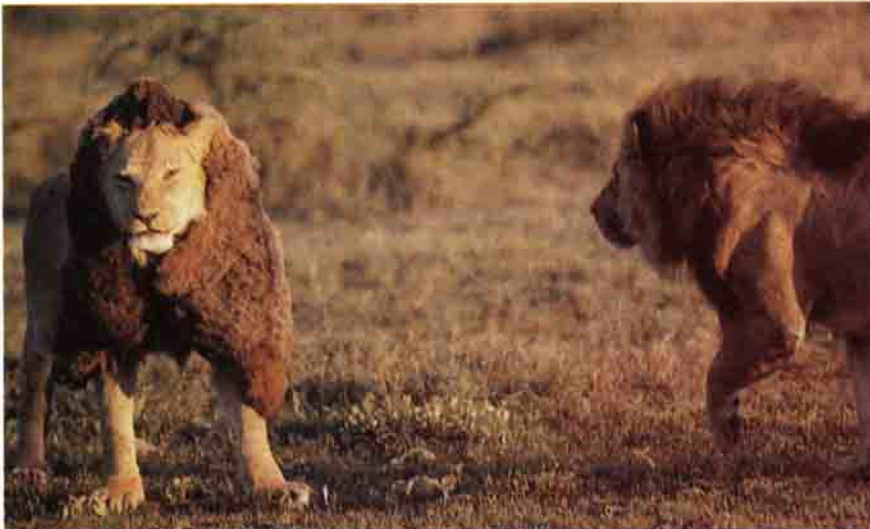
Araştırmacılar, başka aslanların kükremelerini teyp kaydından dinlettiklerinde, erkek aslanlar, sesin geldiği yeri bularak, teybin yanına yerleştirilen doludurmuş, sahte aslanlara saldırıyorlar.

Sürüdeki bazı dişilerin emzirmeleri gereken daha fazla yavrusu olduğundan ve hepsi de hemen hemen aynı süt miktarını ürettikleri için, küçük yavruların anneleri daha cömert olmayı karşılayabi-