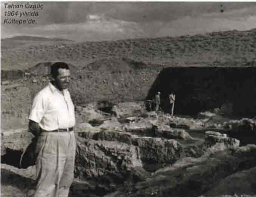
Tahsin Özgüç 1964 yılında Kültepe'de.

Tahsin Özgüç 1946 yılında Dil ve Tarih Coğrafya Fakültesi'nde doçent olur, Nimet Özgüç ise 1949 yılında doçent, 1958 yılında profesör olur. 1954 yılında profesör unvanını alan Tahsin Özgüç, 1968-1969 yıllarında Dil ve