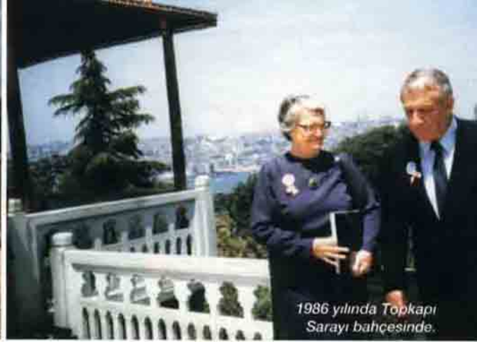
1986 yılında Topkapı Sarayı bahçesinde.

öder, ticaretlerini sürdürürlerdi. Beraberlerinde getirdikleri kalay, tekstil ve elbiseleri yerli halka altın, gümüş karşılığında satarlardı. Yüklü eşeklerin oluşturduğu kervanlar Asur-Kültepe arasındaki 1000 km. yolu 6 haftada tamamlayabiliyorlardı. Bu ticaret sistemi borçlu yerlilere uygulanan % 200 faizle kapitalizmin en eski ve en tipik örneğidir. Sahiplerinin adlarını bildiğimiz bu çağın saray ve mabetlerinde, yerli ve yabancıların evlerinde, arşivlerinde baş ticaret merkezinin zenginliğini