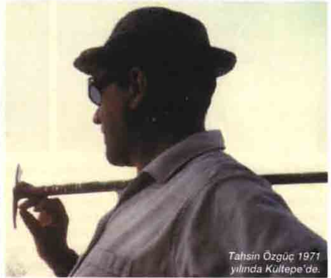
Tahsin Özgüç 1971 yılında Kültepe'de.

ye'de tamamlarlar. Hitler zulmünden kaçarak Türkiye'ye gelen Alman bilim adamlarının bir kısmı Dil ve Tarih Coğrafya Fakültesi'ndedirler ve çağdaş bir bilim ortamı doğmasına yardımcı olmuşlardır. Tahsin ve Nimet Özgüç ileriki yıllarda öğretim üyesi olarak birçok kereler yurtdışında bulunacaklardır. Tahsin Özgüç o günleri "Burada okuduk, orada okuttuk" diye anlatır.