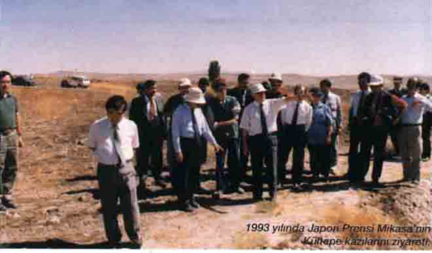
1993 yılında Japon Prensi Mikasa'nın Kültür Eserlerini Ziyaret