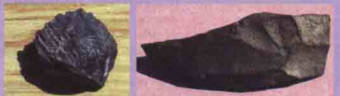
Mağarada bulunan ve 50 000 yıllık olduğu tahmin edilen aletler.

Ray Nelson Popular Science, Mart 1994 Çeviri: Fusun Oralalp