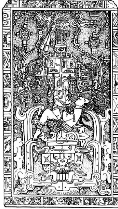
Antik çağdan kalma bir astronot mu? Aslında kral Pacal'in lahit kapağı olan bu resim bir uçuş kabini değil kralın cenaze törenini anlatıyor.

Yıldızlarla ilgili bir şeylerden söz edildiğinde aklınıza astronomi değil de astroloji geliyorsa, sahte bilimin tuzağına düşmüşsünüz demektir. Karşınızdakinin yengeç mi yoksa ikizler burcu mu olduğunu keşfetmeye çalışmanın pratikte hiçbir yararı yok. Bugün kullanılan biçimiyle burçları tanımlayan ve kullanmaya başlayan ilk insanlar Sümerlerdi. Gökbilimin ilk temellerinin atıldığı Sümer uygarlığında gelecekte haber verebilmek amacıyla astrolojiye de başvuruluyordu. Bugün burçlara isimlerini veren Sümerlerin temel amacı gözlem yaparak, taşkın ya-