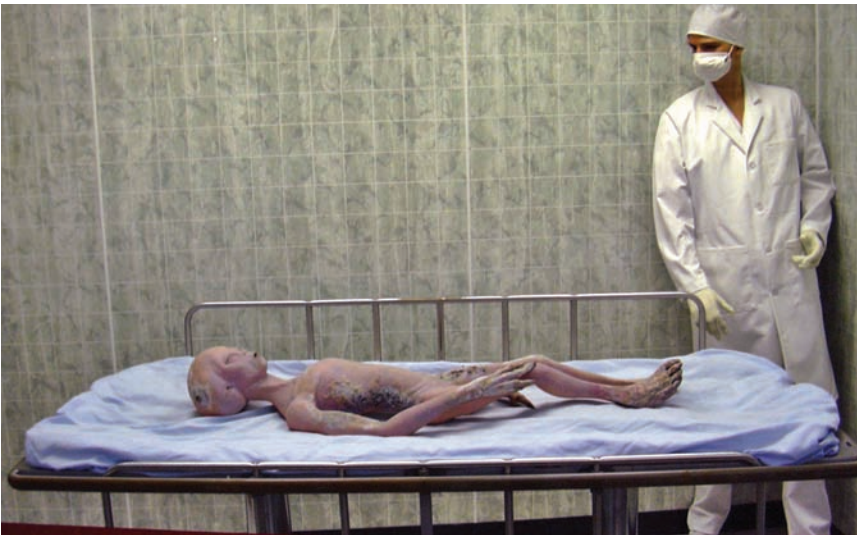
Roswell olayı diye bilinen dünyanın en ünlü UFO vakasında ortaya atılan iddialardan biri uzaydan gelen canlıların cesetleri üzerinde otopsi yapıldığıydı. Yetkililer bunun kurmaca bir olay olduğunu söylediler.

Bilim, insanın aklındaki sorulara yanıt arayan bir olgu. Bu nedenle her zaman bir merak, bir ilgi yaratıyor. Bu ilgi ve merak doyurulamadığı zamanlarda insanlar sözde bilimin tuzağına düşüyor. Sözde bilim de gerçek bilimin kendisi kadar ilgi uyandırıyor. Burada eğitim düzeyi ve bilim kültürü sahibi olmak, belirleyici özellik. Her türlü bilginin sıkça karşımıza çıktığı günümüz dünyasında, özellikle de İnternet ortamında neyin doğru neyin sa-