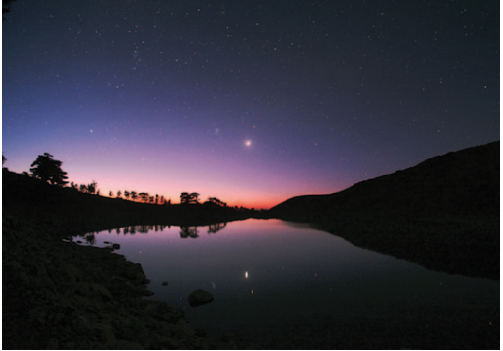
Denizli'deki Kartal Gölü üzerinde Venüs, Mars ve Ülker

"Objektifinizden Gökyüzü" başlığı altında okuyucularımızın gökyüzü fotoğraflarını yayımladığımız bu sayfayı, Dünya Astronomi Yılı süresince bu muhteşem fotoğraflara ayıracağız. Her sayıda TWAN fotoğrafçılarının eserleri arasından seçtiğimiz fotoğrafları burada yayımlayacağız.