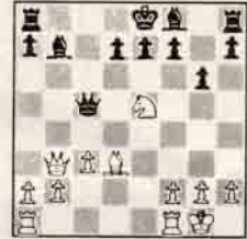
15. Vb3! İspanyol büyük-ustayı düşündüren büyük hamle.