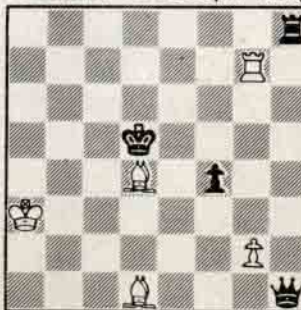
İki hamlede mat