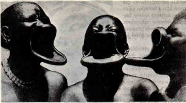
Bu üç Sara (Çad) kadını tepsi biçimindeki dudaklarıyla su aygırını andırıyordular (Chippeaux).

ketlerinin değerlendirilmesinde arkeologlara ve antropologlara önemli ipuçları vermektedir.