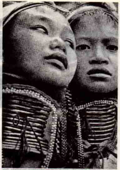
Aşırı ölçüde uzatılmış boyun Padaoug kızlarınınca (Birmanya) bir güzelliğ ölçüsü sayılıyordu (Chippaux).

Orta Doğu'nun, kafa deformasyonu ile ilgili en eski örnekleri vermesi nedeniyle ayrı bir yeri vardır. Nitekim, Kıbrıs'ın Khirokitia bölgesinde ortaya çıkarılan, Cilalı Taş Devrine ait erkek ve kadın kafataslarının büyük bir kısmında biçim bozukluğu görülmüştür. Deformasyon, bu toplumda, kafa arkasındaki belirgin yassılıkla kendini göstermektedir. Öte yandan, Lübnan'ın Akdeniz kıyısındaki şirin bir limanı olan Byblos (el Cebayl)'da ise zamanımızdan aşağı yukarı 4 bin yıl önce yaşadıkları saptanan insanlarda, özellikle kadınlarda, kafa deformasyonu oldukça ragbet gören bir moda idi. İsviçreli arkeolog M. Dunand'ın Byblos kent gömüldüğünde yapmış olduğu kazılarda 205 küp- mezar ortaya çıkarılmıştır. Ölülerin, fôtus pozisyonunda, çoğu kez yalnız, ara sıra da ikşer kondukları (örneğin anne ve kız bir arada) topraktan yapılmış ve pişirerek sertleştirilmiş, tabanı düz küplerde; ölülerin yanına çanak ve çömleklere, küpe ve kolyelere, tahillara da rastlanmıştır. Kazılarda çıkarılan is-