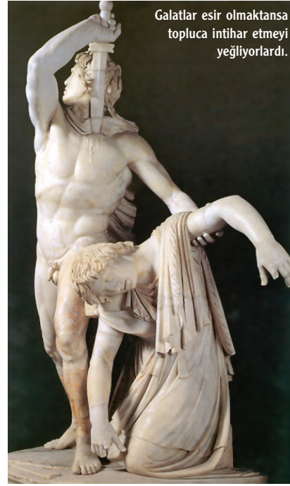
Galatlar esir olmaksızın topluca intihar etmeyi yeğliyorlardı.

"Keltlerin başı olan Şövalye Gnut, savaş sonrası ormanda gezerken çaputlarla süslenmiş kayın ağacına rastlar, burası onun için kutsal bir yerdir ve orada gök