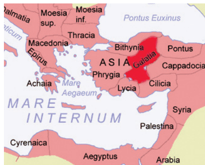
Anadolu'da Galatya bölgesi

Anadolu'ya yağmacı bir kavim olarak gelen Keltler, burada yağmalar yaptılarsa da, bir süre daha uygar bir görünüm ç-