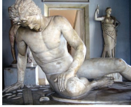
Yaralı Galat savaşçısı. Eski Yunanlılar Galatların kahramanlıklarını heykele dökmüştü.

Ormanlar özellikle yaylayı Bithynia, Karadeniz ve Kafkasya yönünden saran dağların üstündeydi. Galatlar’ın pek sevdiği meşe, gürgen ve çam ormanları, büyük olasılıkla tıpkı Keltlerde olduğu gibi kutsal din adamları druidlerin doğaya yö-