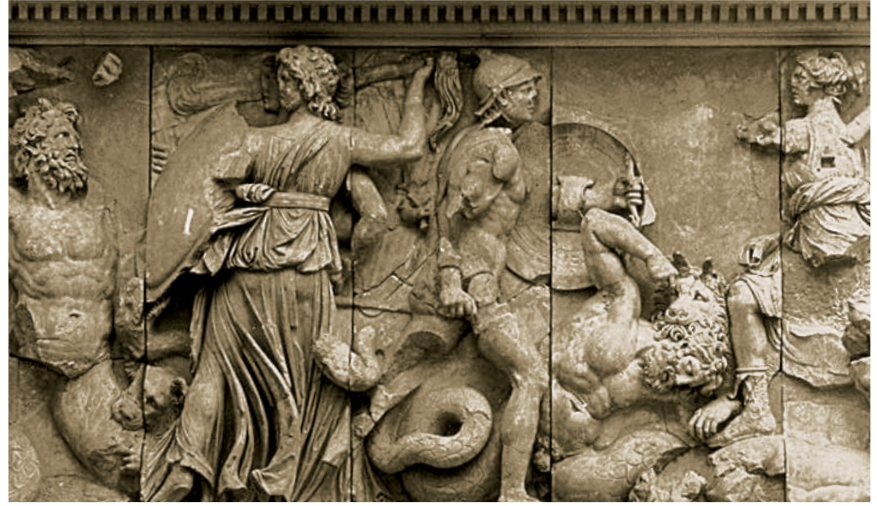
Savaşçı bir kavim olan Galatlar çevre halklara korku salıyordu.

guna uğrayan Mısır ordusunu denize kadar kovalamışlar, hatta Mısırlıların birçok savaş gemisini de ele geçirmişler. 1. Mithridates, Galatların bu yardımına karşılık olarak onlara Kızılırmak ve Sakarya ırmakları arasındaki toprakları bağışlamış. Galatlar, Mısırlıların gemilerinden aldıkları çapaları zaferlerinin bir belgesi olarak beraberlerinde yeni yurtlarına getirmişler ve bölgede bir kent kurup adını, çapa anlamına gelen Ankyra koymuşlar.