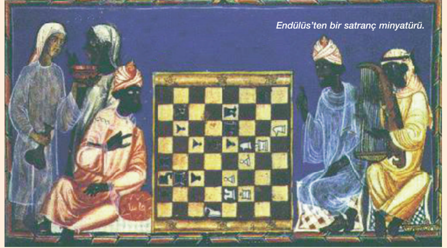
Endülüsten bir satranç minyatürü.

1.d4 d5 2.c4 Ac6 3.Af3 Fg4 4.e3 e5 5. dxe5 dxc4 6.Va4 Vd7 7.Vxc4 O-O-O