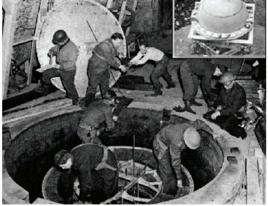
Heigerloch'da bulunan tamamlanmamış bir Alman nükleer reaktörü. Amerikalılar burada bulunan 1200 ton uranyum cevherine el koyarak ülkelerine götürüp nükleer silah yapımında kullandılar.

Hitlers Bombe 'nin yayımlanmasının ardından, özel bir arşivden gelen bir başka belge or-