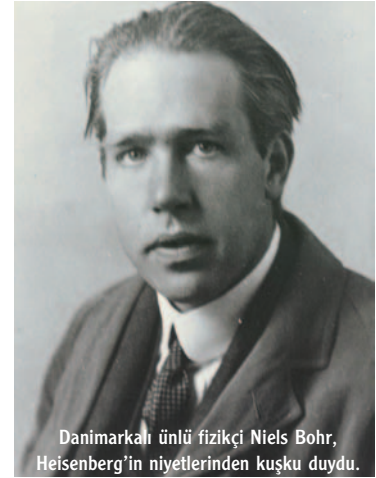
Danimarkalı ünlü fizikçi Niels Bohr, Heisenberg'in niyetlerinden kuşku duydu.