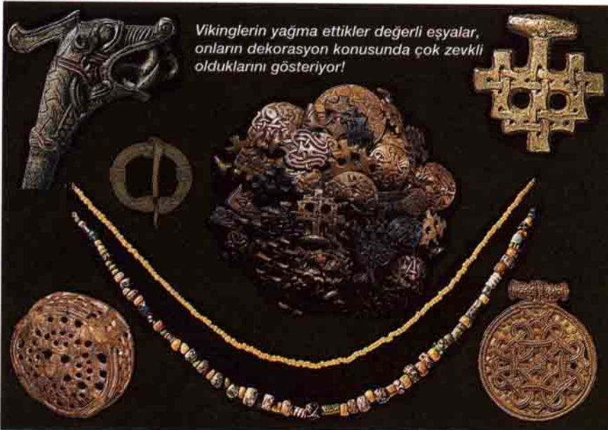
Vikinglerin yağma ettikleri değerli eşyalar, onların dekorasyon konusunda çok zevkli olduklarını gösteriyor!

Kaynaklar Bootsin D.J. (Çeviren: Fatoş Dilber) Keşişler ve Buluşlar , İy Bankası Kültür Yayınları, Ankara, 1994. Emiroğlu K., Finland Sagaları , Ankara, 1996. Rehlander J., Teufel H., "Das wahre Gesicht der Wikinger", Geo Nr 10/1997. Yaşayan Gezegem , Belgesel Film.