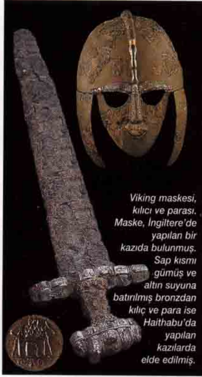
Viking maskesi, kılıcı ve parası. Maske, İngiltere'de yapılan bir kazıda bulunmuş. Sap kısmı gümüş ve altın suyuna batırılmış bronzdan kılıç ve para ise Haithabu'da yapılan kazılarda elde edilmiş.

Vikingler parayı çok severlermiş. Onlara "para hastası insanlar" diyenler de var. Bir söylenceye göre, düşmanın kılıcı, Vikingi para saydığı anda vurur. "7, 8, 9." 9 dediği sırada düşman Vikingin kafasını kopartır, ve Viking kafası düşerken 10 der." İşte bu derece para hırsı varmış bu insanların. Tabii Vikingler epeyce büyük miktarlarda paraya ulaşabiliyorlardı. Genellikle savunmasız kiliselere, tam ayın sırasında saldırıp, talan eder; kilisenin neyi var neyi yoksa alırlarmış. Hıristiyan Avrupa'sında, hazinelerin saklandığı manastır ve kiliseler, hem din adamları, hem de halk tarafından korunuyordu. Bir kiliseyi soymak çok büyük bir suçtu. Bölgedeki dinibütün Hıristiyanların yan gözle bile bakmaya cesaret edemedikleri bu kutsal hazineler, sanki bu yağmacılar için saklanmıştı. Tabii ki Vikingler bu ağız sulandıran hazineyi, bu fırsatı hemencek değerlendirdiler. Keşişlerin kendilerini dünyevi zevklerden uzak tuttukları İrlanda'nın Atlas Okyanusu kıyılarındaki adaları Vikinglerin karşısında duruyordu. Bugün İrlanda'ya giden turistlerin manastır alanının hemen yanı başında gördükleri yüksek taş kuleler, keşişlerin Vikinglere verdiği yanıtı. Bu baca benzeri kuleler, keşişlerin geçici sığınaklarıydı. Yüksekliği 50 m'ye ulaşyordu. Bir Viking saldırısına ait bir haber alındığında, yerden 5 m yüksekliği olan, ufak bir