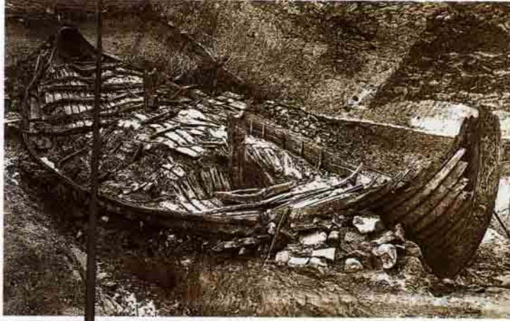
800 yıllarında yapılan bu gemi kalıntısı daha sonraları restore edilmiş. Kalıntı, 1903 yılında Norveç'te bulunmuş. Vikinglerin gemi yapma konusundaki üstün becerilerine ait olağanüstü bir örnek olarak nitelendiriliyor.

Yüzyıllardır tarihçilerin çeşitli fikirler öne sürmelerine neden olan Vinland'ın sırrı ise bir ölçüde de olsa, 1962 yılında çözülmüş. Norveç'li bir bilim adamı olan Dr. Helge Ingstad ve arkeolog eşi tarafından Newfoundland'ın en kuzey ucunda bulunan Viking harabeleri, bizler için Vikinglerin Amerika serüvenine ilişkin önemli ip uçları sunmakta. İskandinavlardan kalma yedi sekiz yerleşim yerinin bulunduğu bu harabelerde, taştan bir örs, demir parçaları, çiviler, tunç parçaları ile birlikte ev yıkıntıları da bulunmaktaymış. Tabii sadece bu kalıntılar değil Vikinglerin Amerika serüvenini anlatan. Özellikle İzlanda dilinde söylenince anlamına gelen "saga" lardan da, Vikinglerin İzlanda, Grönland ve Amerika'ya gidişleri anlatılır. İzlanda tarihinde 930-1050 yılları arası Saga Çağıdır. 1190-1320 yılları arasında da bu sagalar yazıya geçirilmiştir. Örneğin, Vikinglerin İzlanda'dan Grönland'a yapılan göç ve yerleşme girişimleri, anlatımını Snaebjorn Galti'nin sagasında bulur. Buna göre, Kızıl Eirik, İzlanda'ya ilk gelenlerde rastlandığı gibi, bazı cinayetleri nedeniyle Norveç'i terk edip 960'larda İzlanda'ya gelir. Daha fazla cinayet nedeniyle burada da yasadışı ilan edi-