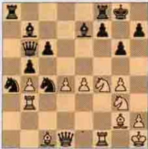
I. Beyaz oynar kazanır.