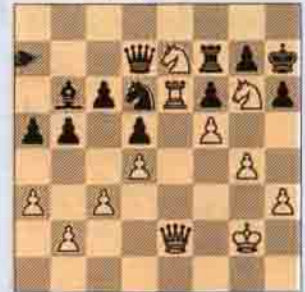
6.a) Beyaz oynar kazanır.