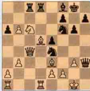
III. Siyah oynar kazanır.