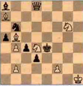
Problem: 2- Jan Hartong, "The Western Morning News and Mercury" 1922, 1. Ödülü, 2 hamlede mat