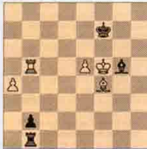
VII. Beyaz oynar kazanır. (7 puan)