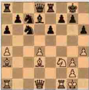
II. Beyaz oynar kazanır.