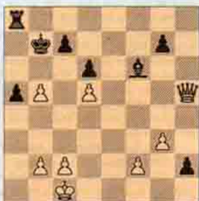
IV. Siyah oynar kazanır. (5 puan)