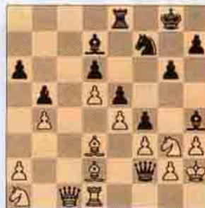
V. Siyah oynar kazanır.