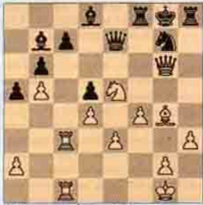
I. Beyaz oynar kazanır. (10 puan)

1 Haziran 1994 tarihine kadar çözümlerinizi dergimiz adresine gönderiniz. En fazla puan toplayan 10 okuyucuya TÜBİTAK'ın Bilim serisinden birer kitap hediye edilecektir.