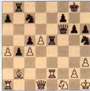
VI. Siyah oynar kazanır. (10 puan)