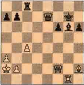
2.a) Beyaz oynar kazanır.