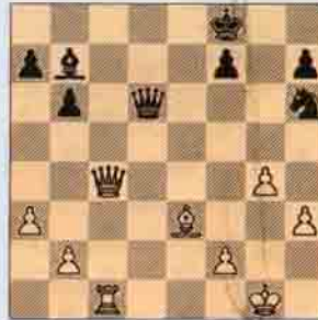
3.a) Beyaz oynar kazanır.