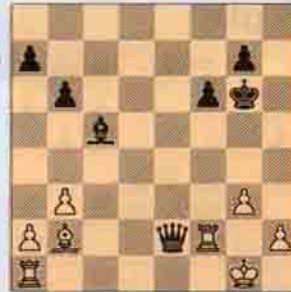
4.b) 1..Ve2 kazanır.