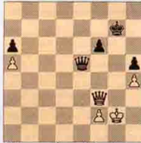
V. Beyaz oynar kazanır. (10 puan)