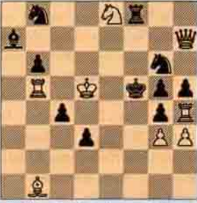
Problem: 1- Allison Howard Gouly "The Observer" 1960, 1. Ödülü, 2 hamlede mat