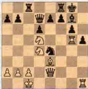
III. Beyaz oynar kazanır. (5 puan)