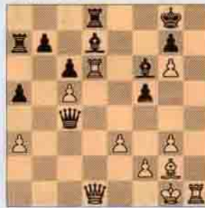
VI. Beyaz oynar kazanır.