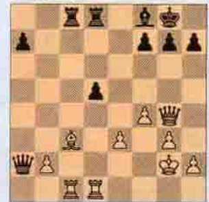
VIII. Beyaz oynar kazanır.