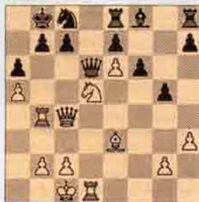
VIII. Beyaz oynar kazanır. (10 puan)