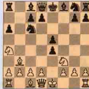
5.a) Beyaz oynar kazanır.