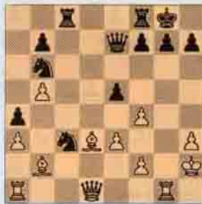
IV. Beyaz oynar kazanır.