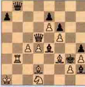
Problem: 3- Godfrey Heathcote Kingstown Society 1904 1. Ödülü, 2 hamlede mat