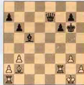
4.a) Siyah oynar kazanır.