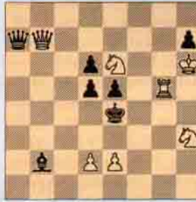
Problem: 4- Godfrey Heathcote "American Chess Bulletin" 1911 1. Ödülü, 2 hamlede mat

Carlos Falcon'a baktı." Kasparov belki saniyenin 1/5'i bir zaman için taşı bırakmış olabileceğini kabul ederken ekledi: "Bay Falcon normal gözlemlere sahip ve bir şey görmedi. Hakemin kararı son olduğuna göre kuralların herhangi bir ihlali söz konusu değil." Uluslararası satranç kurallarına göre dokunulan taş oynanmak zorunda ama oyuncu hamle yaptığı karede taşı elinden bırakmadığı sürece (bu hamleyi geri alınamaz kılar) aynı taşı mümkün olan bir başka kareye oynayabilir. Her iki Dünya birinciliği elemelerinde de adaylığı kılıpayı kaçıran genç Shirov bu turnuva da ise oldukça başarılıydı.