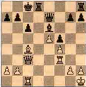
1.a) Beyaz oynar kazanır.