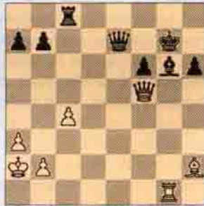
2.b) 1.Vf5 Ve8 2.Kg6 kazanır.