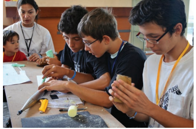
Çeşitli eğlenceli oyunlardan ve etkinliklerden oluşan “Çocuklar İçin Gökbilim Atölyeleri” ve “Model Roket Yapımı”na çocuklar büyük ilgi gösterdiler.

nominin basit bir çanakla bile yapılabileceğini gösteren “Radyo Teleskop Yapımı”; çeşitli eğlenceli oyunlardan ve etkinliklerden oluşan “Çocuklar İçin Gökbilim Atölyeleri”; “Model Roket Yapımı”; Güneş filtresi takılmış teleskoplarla yapılan “Güneş Gözlemleri”; gökyüzü fotoğrafları çekimini ve onların nasıl işleneceğini gösteren uy-