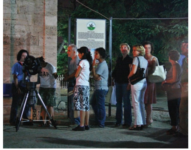
19 Ağustos Pazar akşamı Bursa kent merkezinde düzenlediğimiz halka açık gözlemede, yüzlerce kişiye Ay ve Jüpiter gözlemleri yaptırıldı.

nu ve uzay mekiği, Dünya'nın gölgesine girene kadar yaklaşık 3 dakika sürerince gözlenebildi.