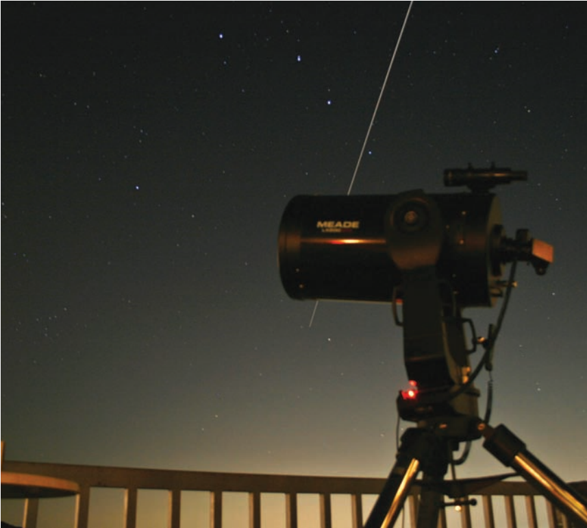
18 Ağustos akşamı, Uluslararası Uzay İstasyonu ve ona kenetlenmiş durumda bulunan Endeavour Uzay Mekiği şenlik alanından gözlemlendi. Uzay istasyonu ve uzay mekiği, Dünya'nın gölgesine girene kadar yaklaşık 3 dakika süresince görülebildi.

Aynı gün, teleskop yapımı atölyesi devam etti. Bunun yanı sıra, gün boyunca yapılan atölye çalışmaları arasında, teleskopların nasıl çalıştığını anlatan "Şeffaf Aletler", radyo astro-