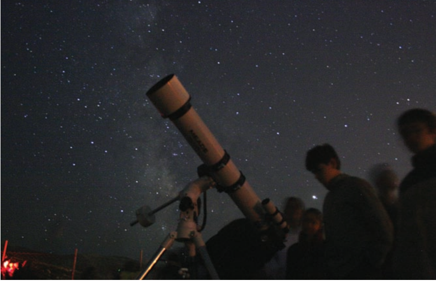
Gözlemler gece-gündüz sürdü. Geceleri, gökadalalar, bulutsular, yıldız kümeleri ve çift yıldızlar gibi gök cisimlerine bakılırken, gündüzleri de Güneş gözlemleri yapıldı.