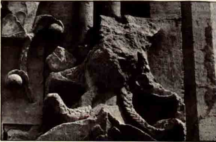
Resim: 9. Şifahane portalinin sağ tarafındaki kadın başı.

duvara bittiği kuzey kenarda çift başlı stilize bir kartal figürü yer alır (Resim 5). Bu kartal herhalde devrin sultanı Alâeddin Keykubad'ın armasıydı. Bunun yanındaki duvarda, başı eğik tek ayağı üzerine basan bir doğan figürü görülür ki, bu da Ahmet Şah'ın arması olabilir (Resim 6). Oğuz boylarının her birinin yırtıcı kuşlardan seçilmiş ongunları vardı. Totem inancıyla ilgili görülen bu