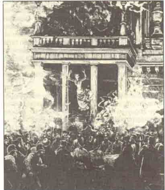
Son perde: 1881'de Viyana'nın Ring tiyatrosunda çıkan yangın, hızla sahneden seyirci bölümüne sıçrayarak 640 kişinin ölümüne yol açtı.

Patlayıcı maddelerin imal ve depolanması da birçok kazaya neden olmuştur. Bunların en gariplerinden biri, 1856'da Osmanlı yönetiminde bulunan Rodos'ta olmuştur. Şimdi "şövalyeler sarayı" diye adlandırılmakta olan binada depolanmış olan barut, bir yıldırım isabeti ile havaya uçmuş, felâkette 4000 kadar kişi ölmüştü.