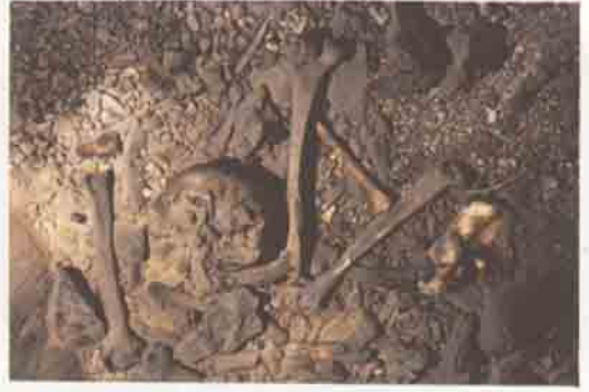
Dim Mağarası'nın gizi: Mağaranın orta kesiminde bulunan insan iskeletine ait kemikler...

Dim Mağarası'nın toplam uzunluğu 357 m'yi bulmaktadır. Alanya gibi turizm potansiyeli yüksek bir ilçemizin çok yakınında bulunması, mağaranın bulunduğu çevrenin ormanlarla kaplı olması, hemen yakınında Dim Çayı gibi güzel bir derenin akması bu mağaranın turizme açılma şansını yükseltmektedir. Bu mağaranın turizme açılması, Alanya ve çevresinin turizmüne yeni bir hüviyet ve hız kazandıracaktır.