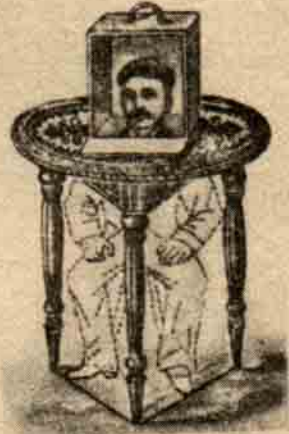
Şekil 1— Kesik kafanın sırrı

Masanın altında hiçbirşey olmadığı izlenimini yaratmak için masanın bir bacağından ötekine uzanan büyük bir ayna koymak yeterlidir, tabii bu aynanın odadaki eşyaları veya seyircileri yansıtmayacak biçimde konulması gerekir. Bunun için de odada hiçbir eşya bulunmaması, bütün duvarların birbirinin aynı olması, tek renk ve süsüz bir döşeme bulunması şarttır. Tabii seyirci de masadan yeteri kadar uzağa oturmalıdır. Görüyorsunuz ki bu işin "sırrı" peynir ekmeğe kadar basittir, fakat aynaların görülmez olduğunu bilmiyorsanız "aklınız şaşar".