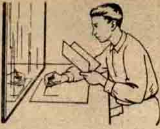
Şekil 3— Aynanın önünde şekil çiziniz

yazmağa çalışın, ortaya karma karışık ve komik şekiller çıkacağına emin olabilirsiniz.