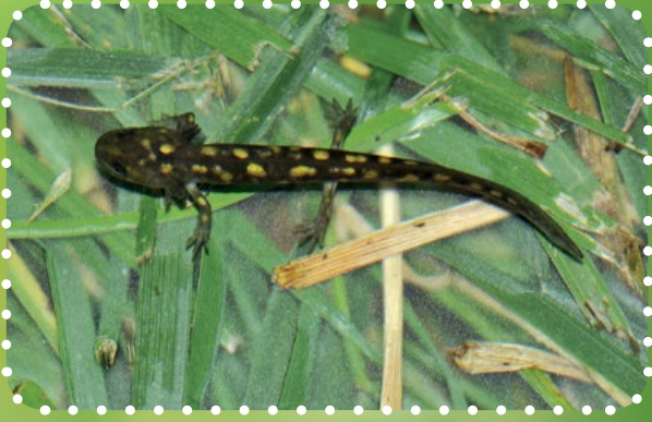
Yavru Anadolu benekli semenderi

Yetişkinler kayaların altında ya da yuvalarında kış uykusuna yatar, ilkbaharda karların erimesiyle etkinleşir. Sonra da kenarında bitki örtüsü olan sulak yerlere gelerek yumurtlar ve karaya doğru geri göç ederler. Yumurtalardan yaklaşık bir ay sonra larvalar çıkar. Larvaların boyu 12-15 milimetre uzunlukta olur. Boyları 60-70 milimetre kadar olduğundaysa başkalaşım geçirerek sudan karaya çıkarlar.